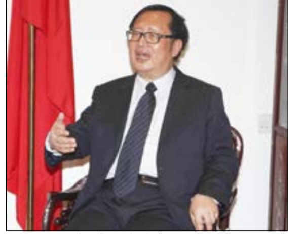
البروفيسور يانغ جيميان متحدثاً خلال المؤتمر الصحفي

الى كونها مركز الاقتصاد والمكان الجاذب لرؤوس الاموال» واصفاً من «يسيطر العالم»، موضحاً أن «بلاده ما زالت في منتصف الطريق في الاقتصاد وتعلم كثيراً من الخبرات ومن الأخطاء السابقة». معتبراً في الوقت نفسه ان «العالم لن يستطيع احراز اي تقدم بدون الصين وكذلك فإن الصين بحاجة الى العالم للتقدم».