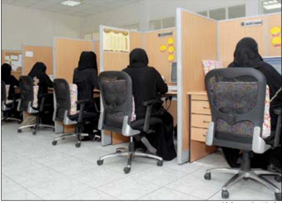
مركز الاتصال ببيت الزكاة

بييت الزكاة استحدثت نظاماً جديداً للبدالة، يضمن من خلاله تقديم الخدمة بأسهل وأسرع وقت ممكن وبجودة عالية. لافتة إلى أن المركز يقدم معلومات متكاملة عن المراكز الإيرادية التابعة للبيت وتوضيح مفصل لعملها والخدمات المقدمة فيها. كما أشارت إلى أن المركز أراح مراجعته من تكبد عناء مراجعة البيت، وساهم في تخفيف الأزدحام على مراكز الخدمة في بيت الزكاة، من خلال الرد على استفساراتهم عن نتائج معاملاتهم، وموعد المراجعة، والأوراق المطلوبة لإتمام المعاملة، وطلبات القروض، والضمان الصحي.