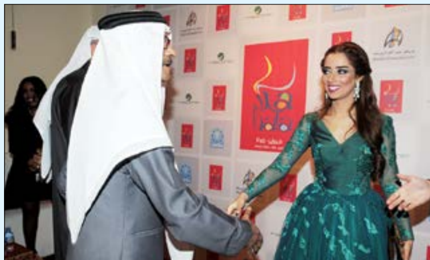
... ومرحبة بالمطرب رابع صقر