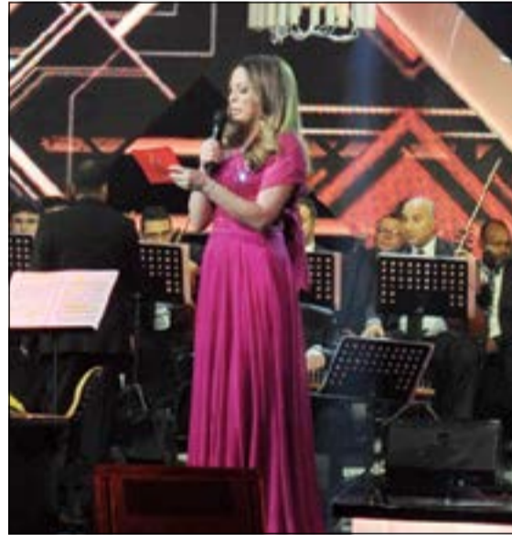
رائيا السبع أثناء تقديم وصلة مطرف الطرف