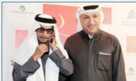
رئيس «روتانا» سالم الهندي ورابع صقر

جالت كاميرا «الأنباء» في كواليس الحفل الرابع لمهرجان «هلا فبراير» والذي أحياه الفنان الشاب مطرف المطرف والمطربة اليمينية بلقيس والنجم السعودي رابع صقر، وننشر منها بعض الصور الحصرية.