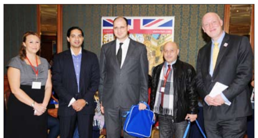
عدد من المشاركين في المعرض

إلى بريطانيا». وعن الهدف من المعرض لفت إلى «أنهم يسعون لعرض منتجاتهم السياحية خصوصاً من ناحية الفنادق والمنتجعات، وذلك لجذب السياح الكويتيين الذين يملكون منازل في لندن لزيارة هذه المنتجعات والاستفادة من الخدمات التي تقدمها». لافتاً إلى أن عدد السياح الكويتيين إلى بريطانيا لعام 2012 وصل إلى 66 ألفاً متوقعاً أن تسجل إحصائية عام 2013 رقماً قياسياً من ناحية عدد الزوار الكويتيين. وأشار إلى أن «العدد الإجمالي للزوار من دول مجلس التعاون الخليجي بنسبة 10٪، فيما ارتفع معدل الإنفاق بنسبة 11٪، مشيراً إلى أن هذا المستوى من النمو «نتج عن بلوغ عدد الزوار ومعدل الإنفاق أرقاماً قياسية في الفترة الممتدة بين يناير وسبتمبر» موضحاً أن «الإنفاق تخطى مليار جنيه إسترليني خلال إجمالي الزيارات التي بلغت 452 ألفاً من دول مجلس التعاون