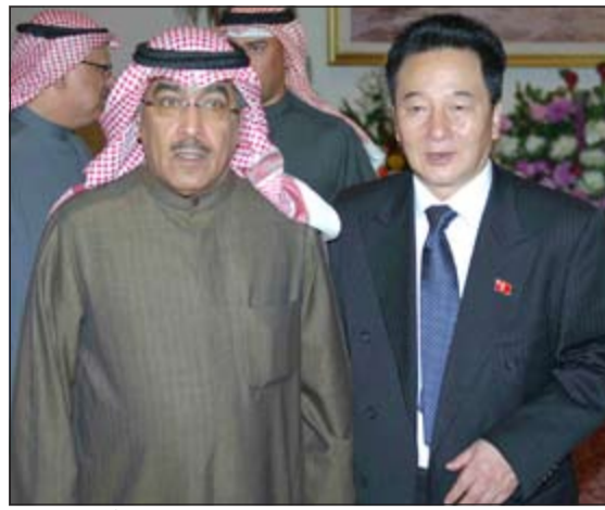
الزميل عدنان الراشد يقدم التهانّي للسفير سو تشانغ سيك (أنور الكندري)