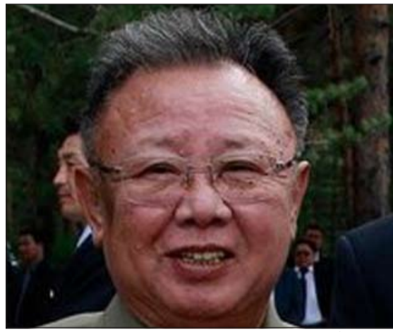
كيم جونج ايل