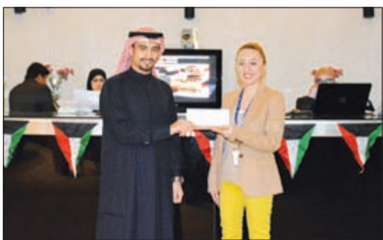
جانب من تقديم الهدايا

وأضافت: «نود أن نغتنم جميع الفرص لتقديم خدمات خاصة وعروض جديدة تتناسب مع جميع عملائنا، وهذه الاحتفالات تعتبر الفرصة الأمثل لكي نجبر عن ولأنا لبلدنا الحبيب ولعملائنا الكرام».