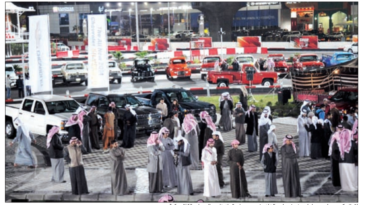
إقبال كبير على سيارات شيفروليه الغانم في مهرجان الوانينات والجيبات الكلاسيكية

كما يساهم في تعزيز مجموعة الشركة من السيارات