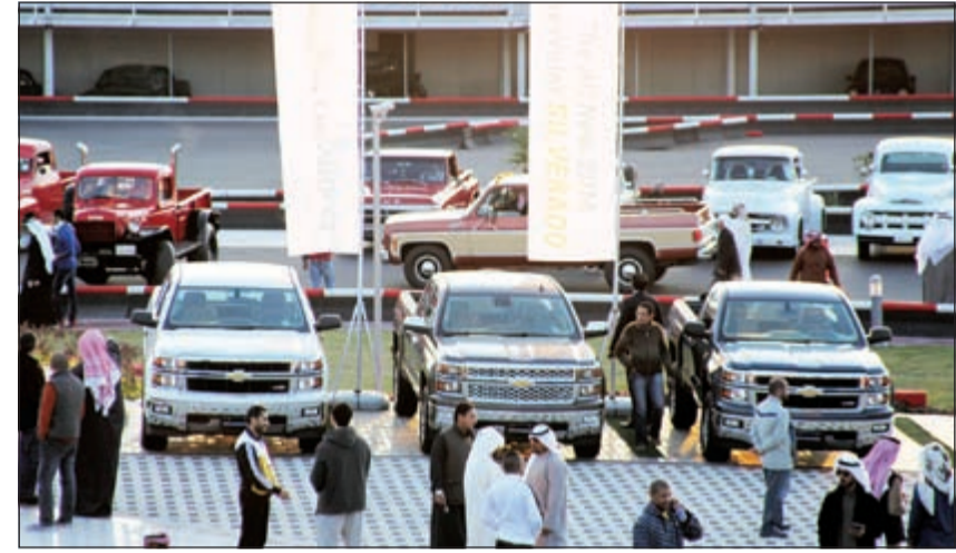
عروض مميزة لسيارات شيفروليه الغانم خلال المهرجان