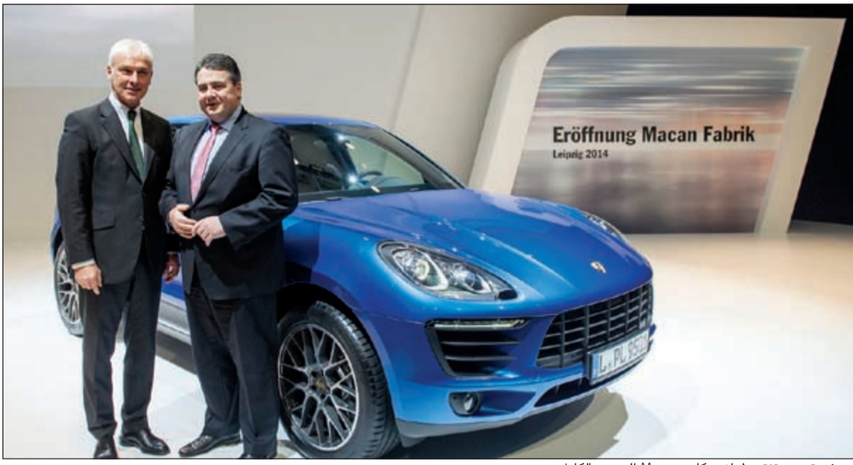
بورشه تيدع وتنتج طراز «مكان» Macan الجديد بالكامل