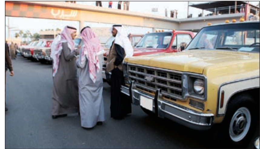
سيارات شيفروليه الغانم القديمة تتالق خلال المهرجان

ضمن اهتمامها الدائم بتطوير وتقديم أفضل العروض الترويجية لعملائها وبأفضل الطرق، قامت شركة يوسف أحمد الغانم وأولاده للسيارات، الموسوع الوحيد لسيارات شيفروليه في الكويت بالمشاركة في مهرجان الوانينات والجيبات الكلاسيكية، حيث قامت بعرض 3 من سيارات شيفروليه سيلفرادو 2014 الجديدة بالكامل، إضافة إلى عرض لجيل مختلف من شيفروليه سيلفرادو على حلبة سرب في 7 فبراير.