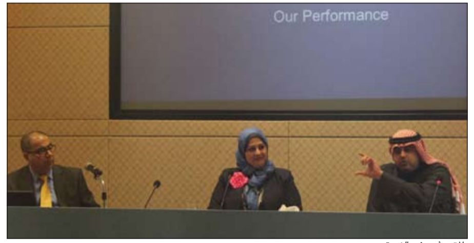
المندوبون في الندوة

ولفت التقرير إلى توقعات المحللين لنمو الطلب العالمي على النفط للعام 2014 خلال الأشهر الماضية. وتوقعت الوكالة الدولية للطاقة زيادة الطلب على النفط بواقع 1,3 مليون برميل يوميا خلال العام الحالي أو بواقع 1,4 مليون برميل يوميا مقارنة مع 1,2 مليون برميل يوميا للعام الحالي في الشهر الماضي و1,2 مليون برميل يوميا للعام 2013. كما قام مركز دراسات الطاقة العالمية بمراجعة توقعاته بنسبة أكبر.