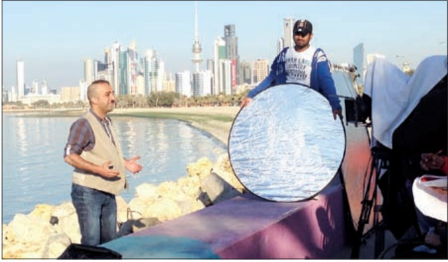
مشهد من «طربان»