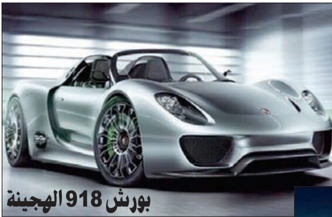
بورش 918 الهجينة