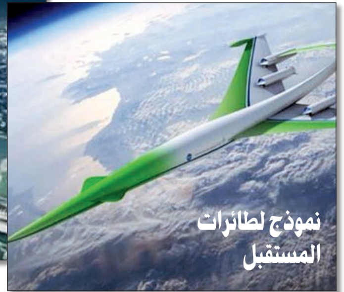
نموذج لطائرات المستقبل

احمد يوسف اصدر حساب @googlepics على تويتر مجموعة من الصور المتوقعة لما سيكون عليه العالم في المستقبل، وخص الحساب صورة لمدينة دبي وكيف ستبدو في العام 2180، ومدينة ليفربول البريطانية ومظهرها العام المتوقع خلال العام 2109، وأيضا مدينة ديترويت الامريكية معقل أخرى من الصناعات.