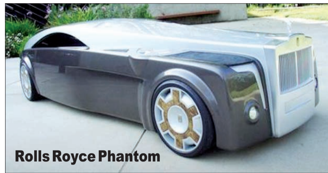
Rolls Royce Phantom