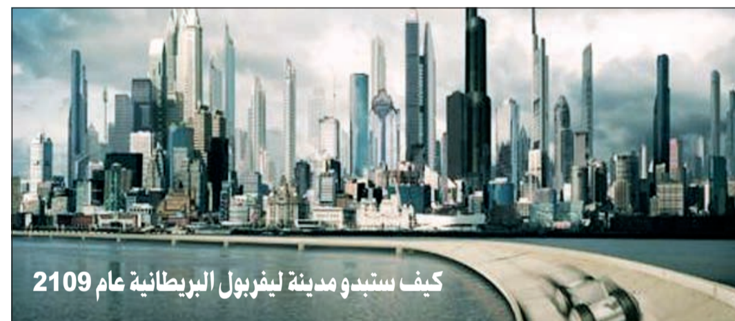
كيف ستبدو مدينة ليفربول البريطانية عام 2109