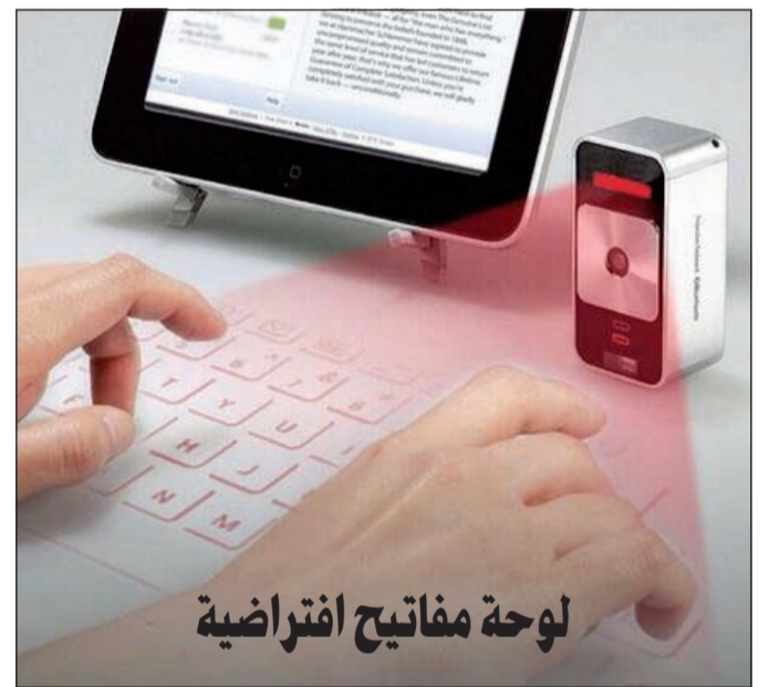
لوحة مفاتيح افتراضية