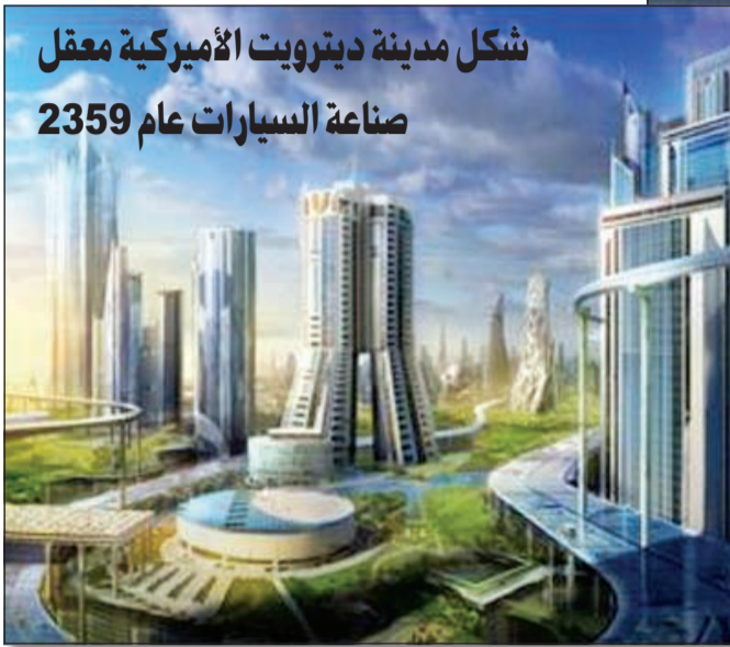
شكل مدينة ديترويت الأميركية معقل صناعة السيارات عام 2359