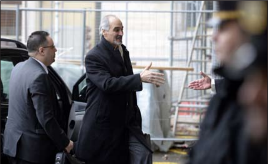
ممثل الحكومة السورية في الامم المتحدة بشار الجعفري متوجها الى المفاوضات مع الأخضر الابراهيمي

إلى ذلك طالب السب السوري إلى المفاوضات جنيف الأمم المتحدة بإلزام الدول الداعمة للإرهاب بالتوقف عن هذه السياسة تنفيذا لقرارات مجلس الأمن.