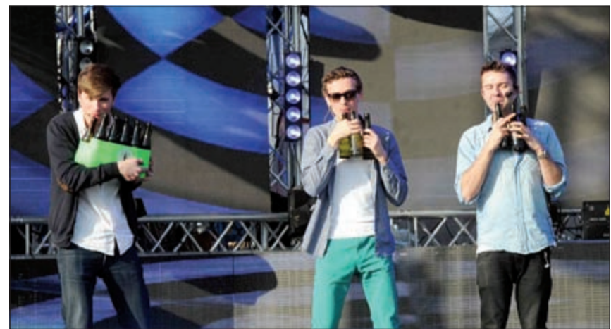
«الأولاد باند» وفقرة موسيقية بالزجاجات

الإعجاب الشديد ممن شاهدوه من المتفرجين الذين قابلوه بالتصفيق الحار مع كل قطعة موسيقية متميزة تعرفها الفرقة. ثم صعدت المسرح فرقة «Ballon Dancers» التي أبهرت المشاهدين بأكروبات حية وألعاب حركية رائعة داخل البالون، في أنسبائية ومرونة مذهلة لفتت الفرقة داخل البالون، شدت الانتباه من بداية العرض وحتى نهايته، بعدها كان عرض فرقة «BMX Show» التي جذب أعضاؤها بمهاراتهم في رياضة الدرجات الهوائية التي يؤدون عليها حركات مثيرة وخطيرة، حتى أن الجمهور لم يتوقف عن التصفيق والهتاف لأفراد الفريق في تفاعل وانسجام كاملين مع العرض.