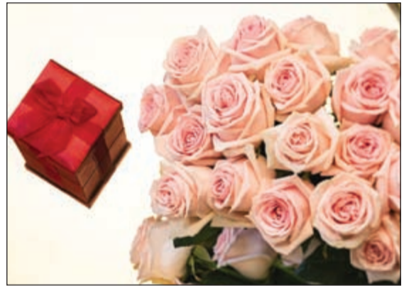
الحدث، وتشمل أطباقا عربية وعالمية لترضي جميع الأذواق