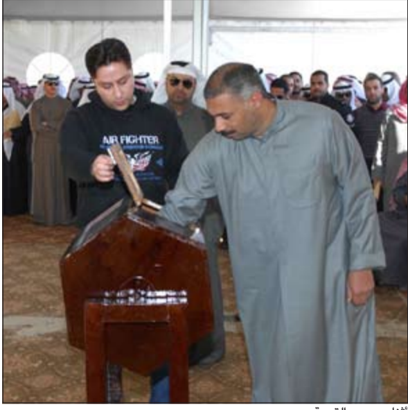
أثناء سحب القرعة