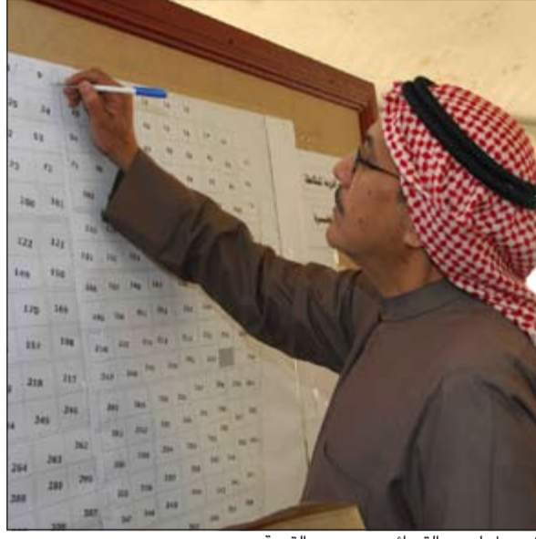
تسجيل إحدى القسائم بعد سحب القرعة

على 396 قسيمة، موضحا أن القسائم التي تم سحبها لصالح وزارة الداخلية جاءت مراعاة للاتفاقية الأمنية مع الجانب السعودي والقاضية بضرورة أن يكون هناك ارتداد حدودي بين البلدين لا يقل عن 2 كيلو مترين مربعين لدواع أمنية. وبين البدر أن هذه القسائم تم التقدم لها قبل فترة، وجرى التدقيق في مستندات الشركات المتقدمة بعد تقديم ضمان مالي قدره 100 ألف دينار باسم هيئة الزراعة، على أن يتم الإفراج عنه بعد أسبوع لمن لم يحالفه الحظ، أما من حصل على قسيمة فسيستكمل إجراءاته في توقيع العقود والتعهدات المطلوبة في إدارة القسائم الزراعية 17 مارس المقبل. وشدد على أنه لا يحق لأصحاب القسائم التنازل عنها أو إدخال أي شريك أو بيعها إلا بعد مرور 5 سنوات من تاريخ توقيع العقد، بالإضافة إلى عدم الإفراج عن الضمان المالي إلا بعد استكمال كل المباني المطلوبة في مدة سنة من تاريخ توقيع العقد، موضحا أنه في حال عدم التنفيذ فإنه سيتم سحب القسائم فوراً، وذلك لمزيد من الجدية ولتحقيق الهدف من التوزيع في توفير الأمن الغذائي للبلاد.