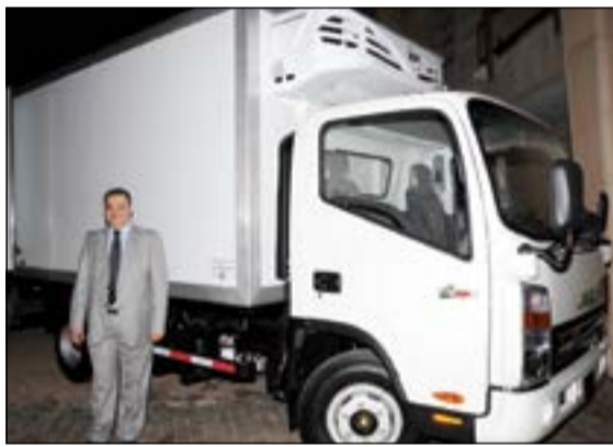
إحدى سيارات النقل المبرد التابعة لمجموعة الحساوي