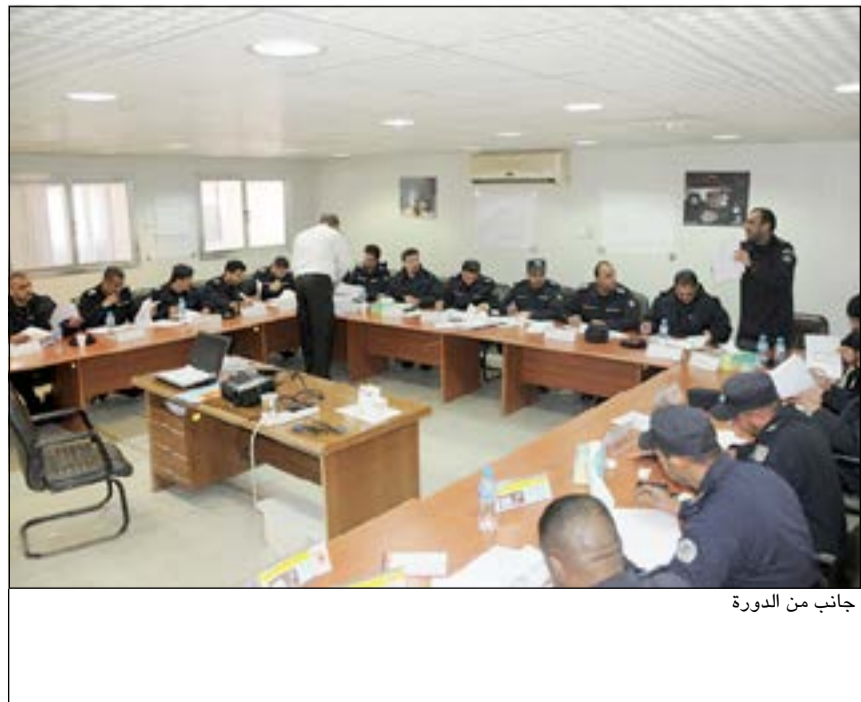
جانب من الدورة