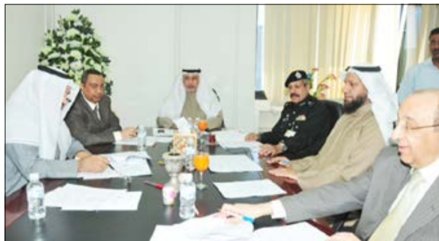
حمد المعضادي مترسماً الاجتماع بحضور الشيخ فيصل النواف ودخالد السهلاوي وجمال الدوسري

أن يكون دخول أي وافد للبلاد مشروط بكونه لائقاً طبياً ويحمل ما يثبت هذا. وقال إن اللجنة ستقوم برفع تقريرها لوزيرة الشؤون هند الصبيح بما انتهت إليه من توصيات وقرارات للنظر في شأنها واتخاذ ما يلزم نحو هذه التوصيات. وشارك في الاجتماع كل من وكيل وزارة الصحة د. خالد السهلاوي والشيخ فيصل نواف الأحمد الوكيل المساعد لشؤون الجنسية والجوازات والمستشار بداح الدوسري من وزارة الخارجية والوكيل المساعد لشؤون العمل جمال الدوسري والأزهري فوزي المستشار القانوني بمكتب وكيل وزارة الشؤون الاجتماعية والعمل.