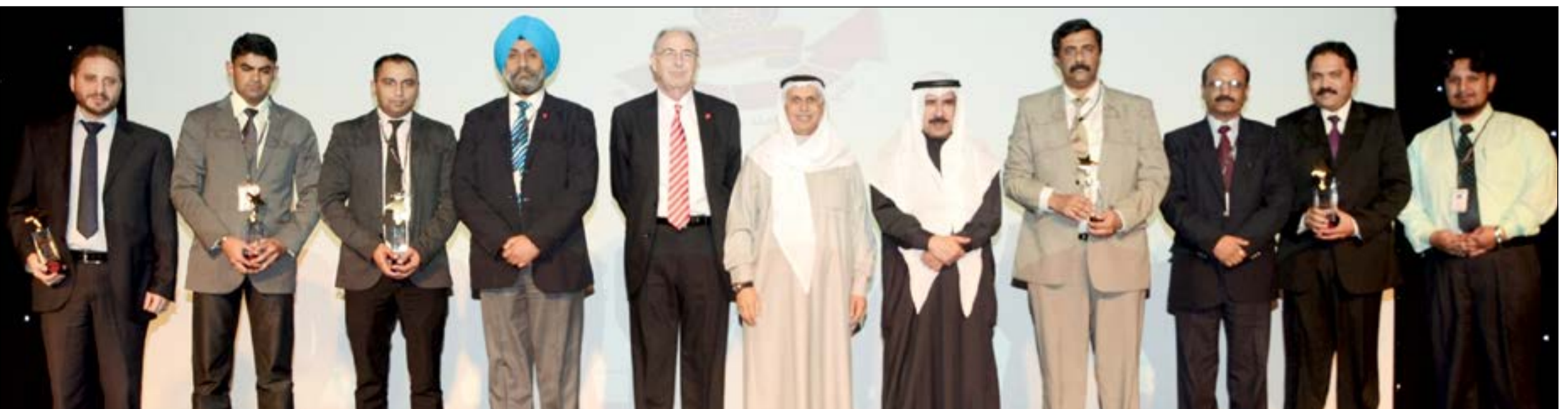
..ومجموعة أخرى من المكرمين