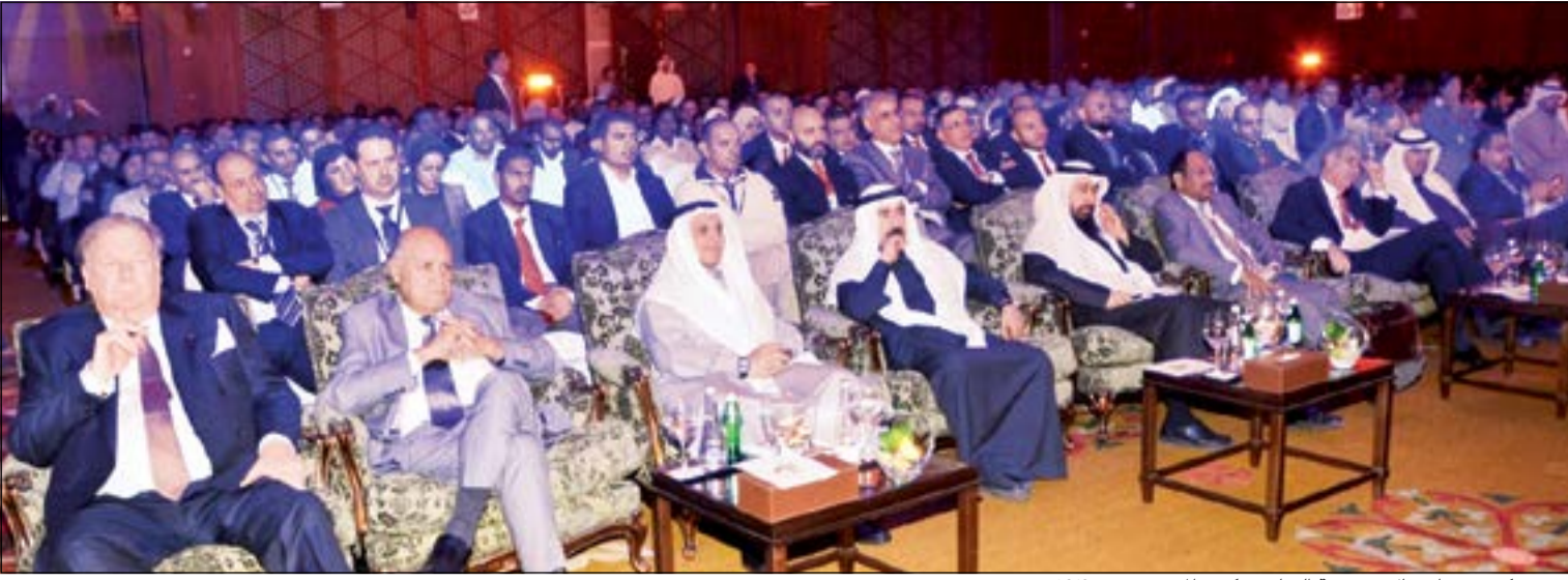
حضور كبير في احتفال مجموعة السايير بتكريم المتميزين في 2013