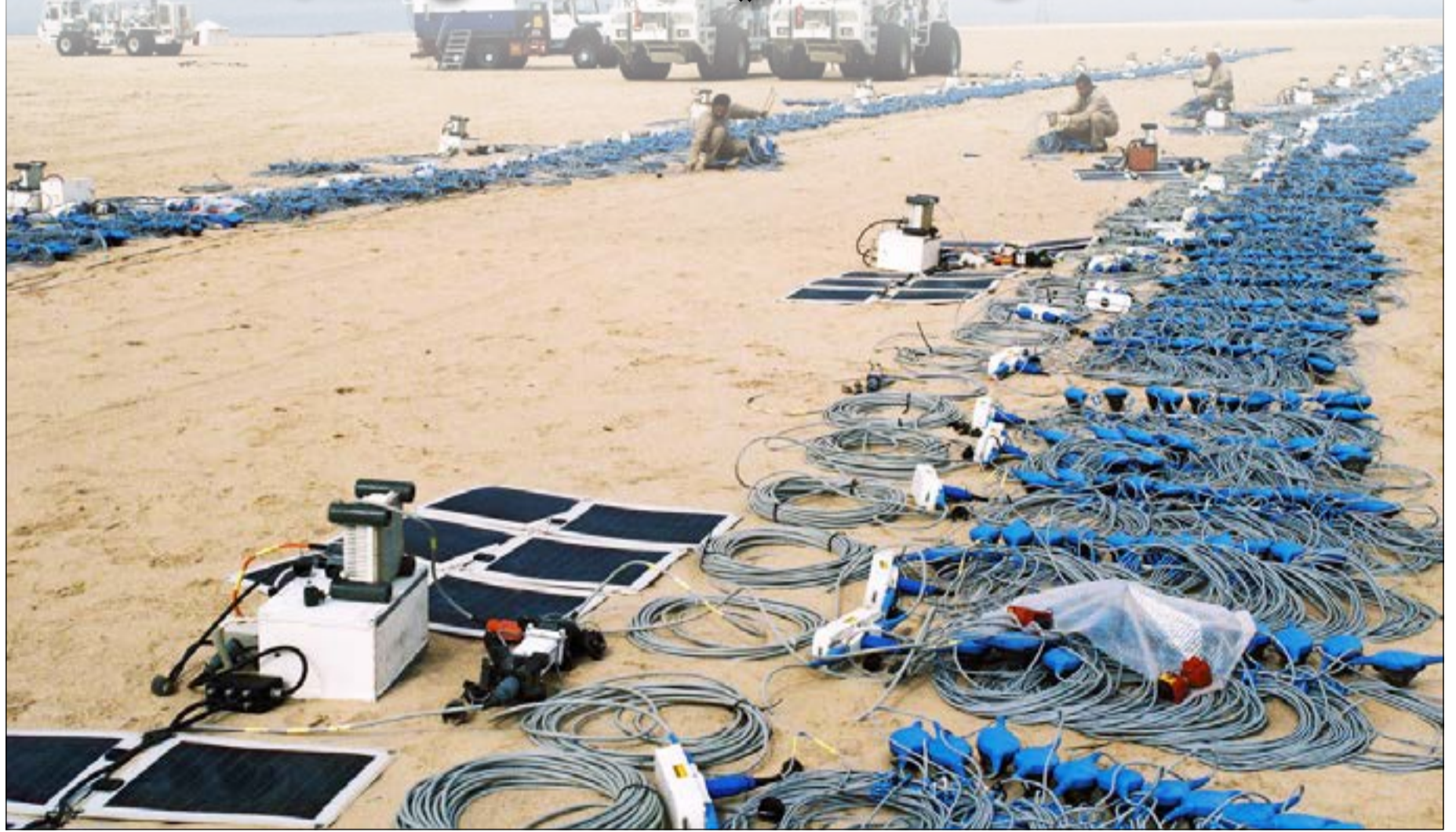
الانتهاء من المسح الزلزالي في منطقة شمال الكويت بحلول شهر يونيو المقبل