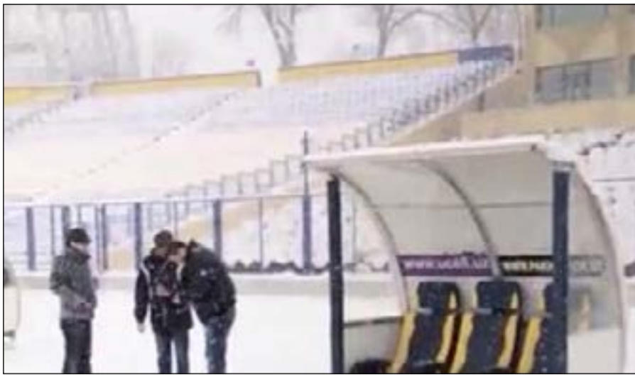
الثلوج تغطي ملعب المباراة

وقال الدبيس ان البطولة ستقام بنظام خروج المغلوب ومن حق كل فريق ان يقوم بتسجيل 7 لاعبين في القائمة الخاصة به على ان يكون داخل الملعب 6 لاعبين حيث تقام البطولة بنظام السداسيات.