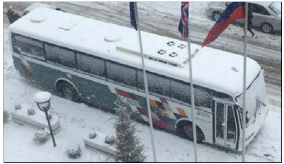
باص لاعبي الكويت مغطى بالثلوج