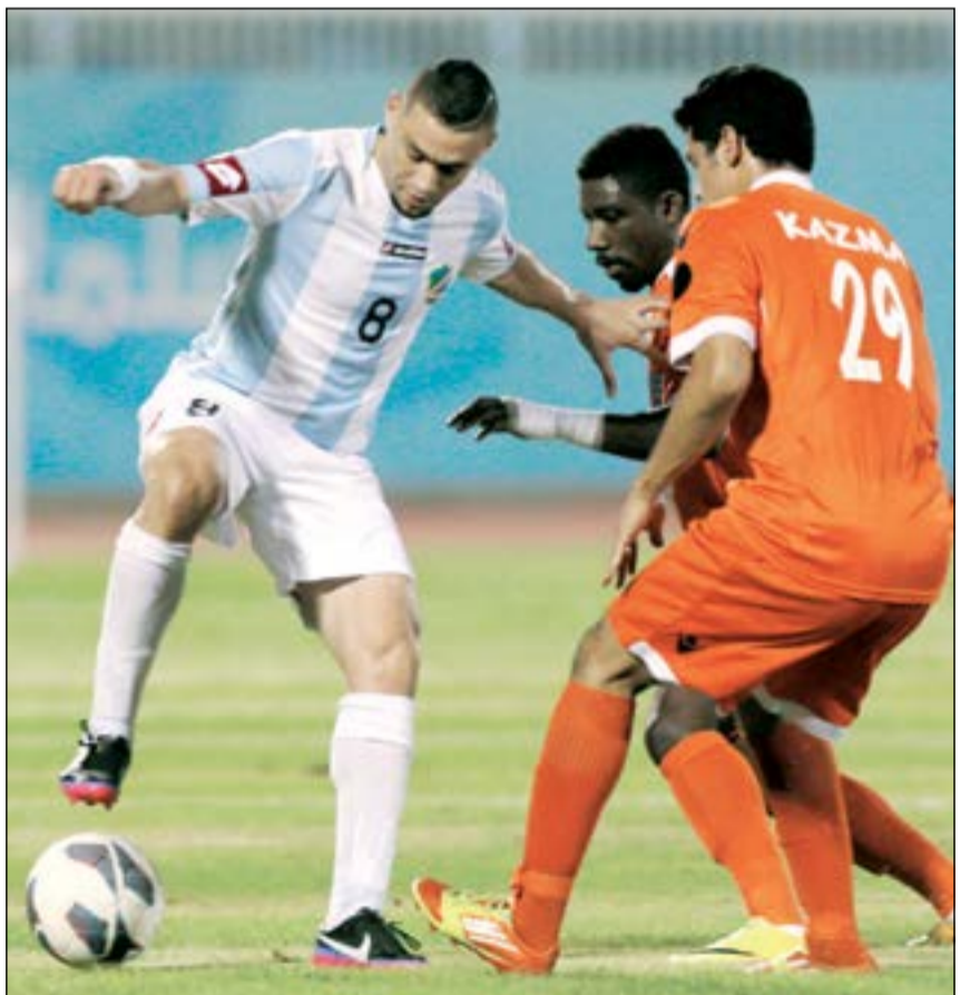
دفاع كاظمة يسعى لإيقاف خطورة عدي الصيقي