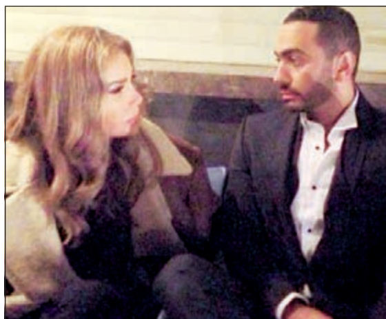
الصورة الأولى لتامر ونيكول من مسلسل «ياسين»

القليلة الماضية. ويشترك في بطولة المسلسل أيضا كل من أحمد السعدني، وصفاء الطوشي، والعمل الذي يخرجه إسلام خيرى والفقه محمد سليمان، سيعرض خلال شهر رمضان المقبل.