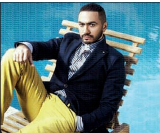
تامر حسني بنطلون أصفر