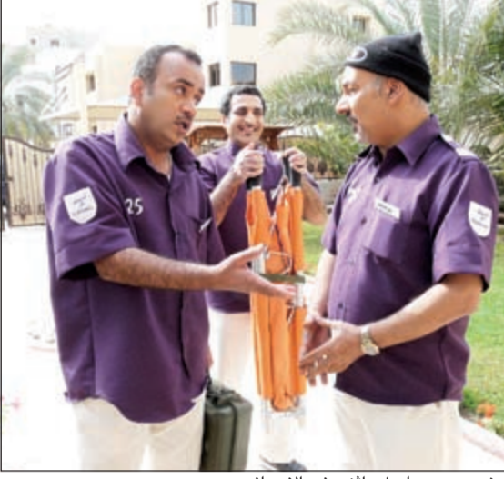
مشهد من مسلسل «اثنين في الإسعاف»