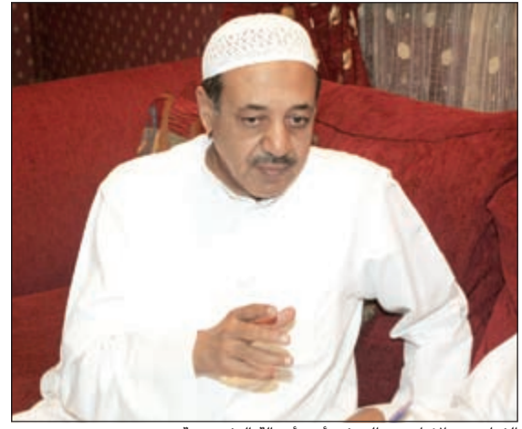
الفنان عبدالإمام عبدالله في أحد أعماله التلفزيونية

ويجسد عبدالله في مسلسل «رصاصه منال» دور أب يفقد ابنه الذي يتعرض لجريمة قتل على يد مجهول لتكون جريمة