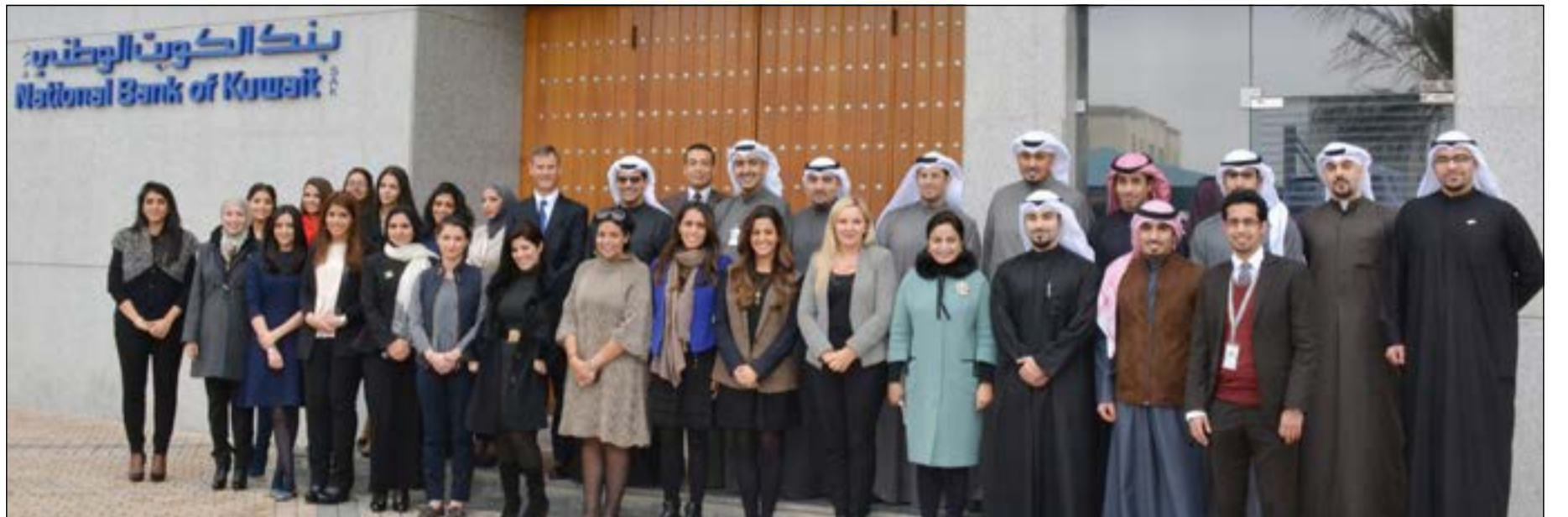
قيادات من البنك الوطني في صورة جماعية مع المتدربين من الموظفين الجدد