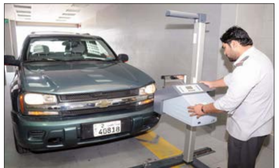
عملية الكشف عن مصابيح المركبة