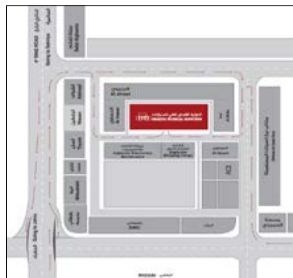
رسم بياني يوضح موقع الشركة