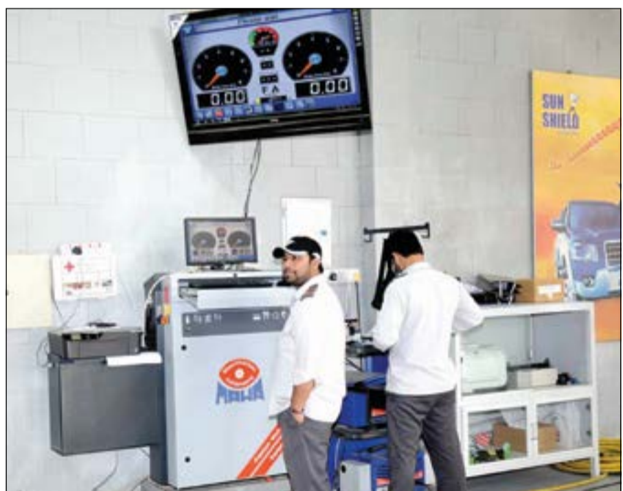
جهاز الكشف عن العيوب داخل المركبات وهو مربوط بجميع الأجهزة الأخرى لتظهر النتائج على الشاشة