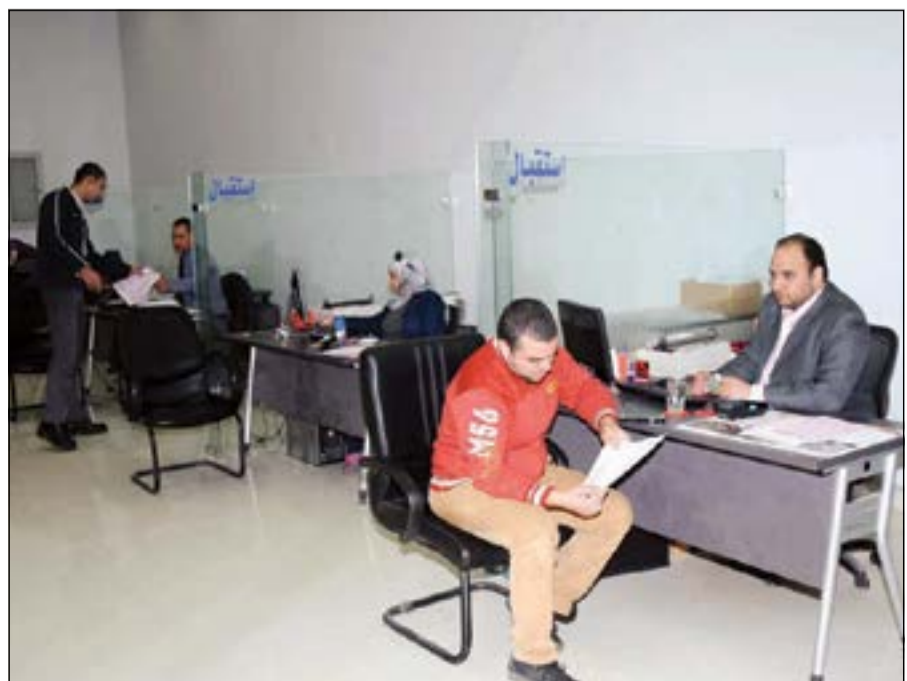
«سهلة» في الإجراءات

والتأمين عليها ثم أعادتها إلى صاحبها بتكلفة 20 ديناراً فقط بينما قيمة الخدمة العادية هي 10 دنانير.