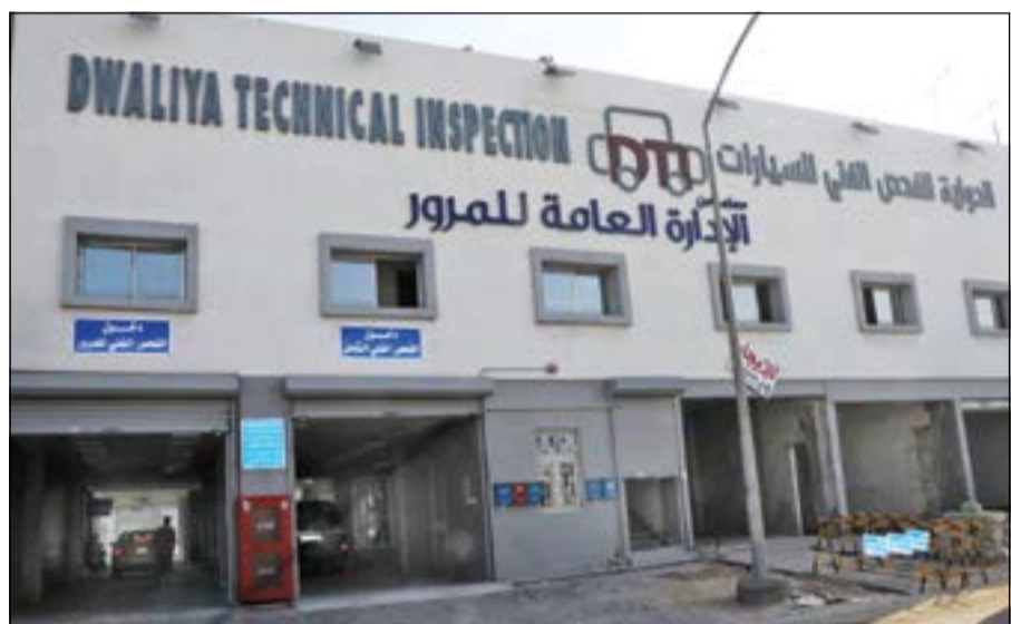
مركز الدولية للفحص الفني للسيارات