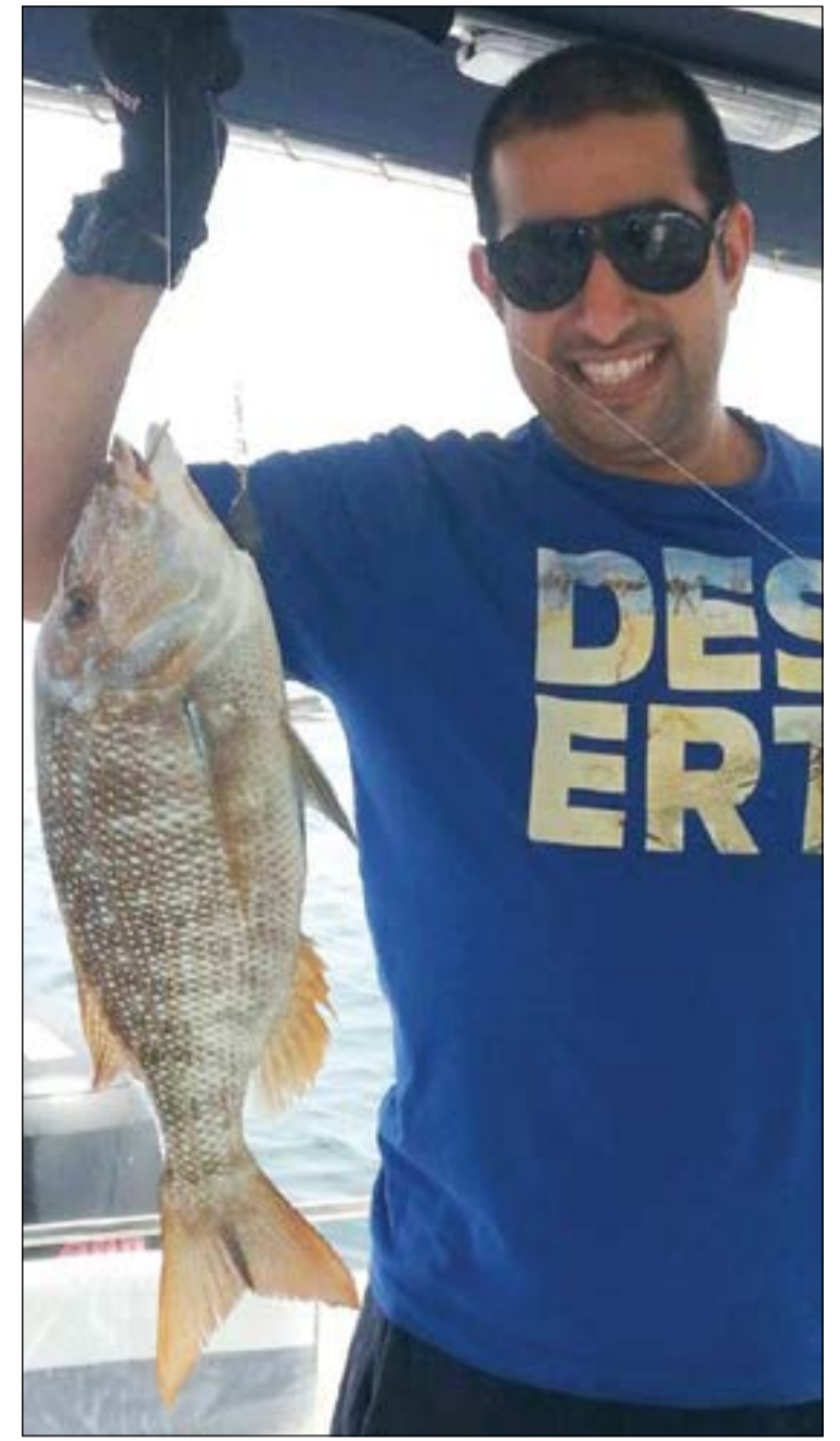
شعري الجنوب غير شكل