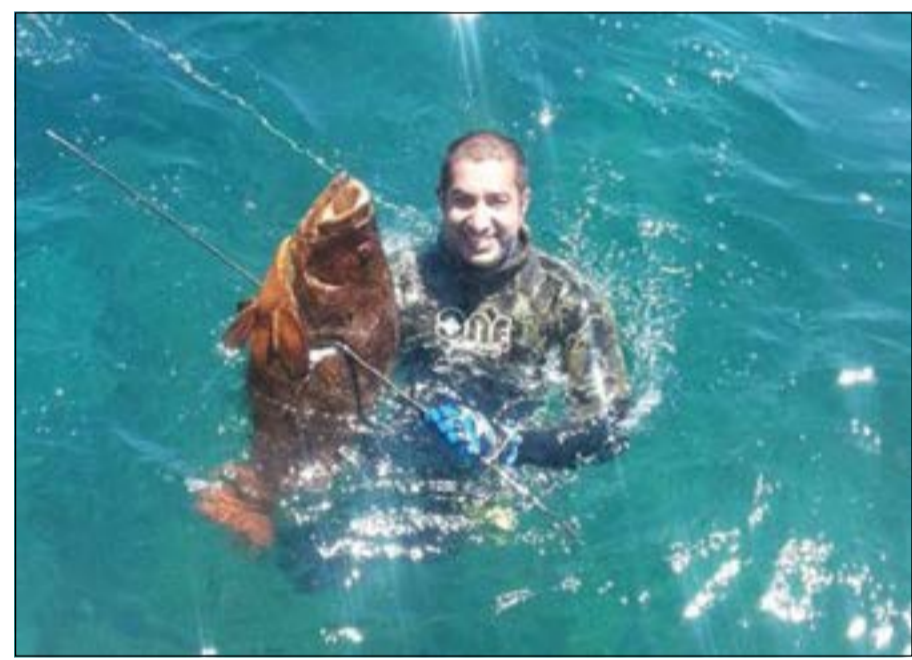
الاصابة الدقيقة في المطلوبة

أنواع المسدسات البحرية وأيها تفضل؟ ● أنواع المسدسات البحرية تنقسم إلى نوعين، النوع الأول