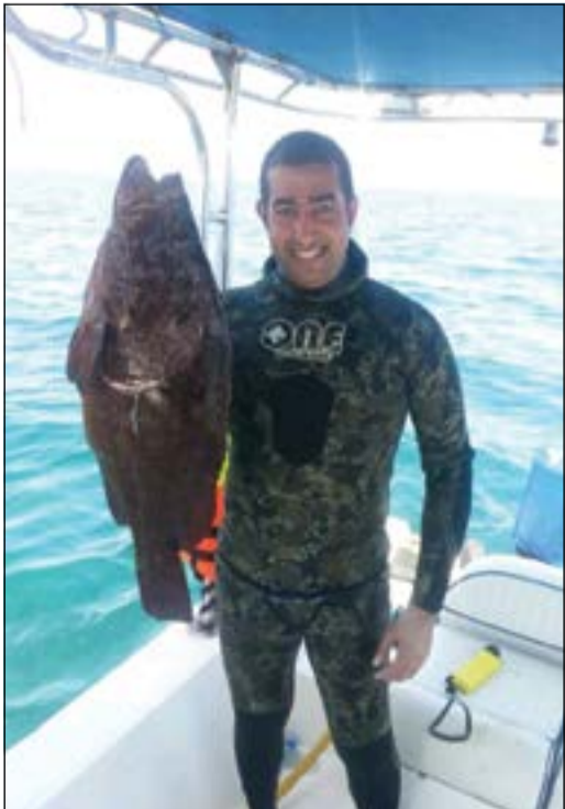
هامور منطقة خصب