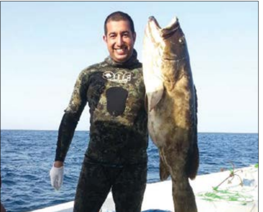
هامور على كيفك