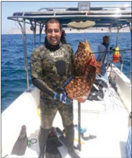
عمان اسماكها متنوعة