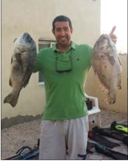
صيد الشعن العماني

«بحري» صفحة تستقبلكم كل أربعاء بكل ما يعنى بالبحر وهواية الحدائق أسبوعياً نسلط الضوء على هذه الهواية، ونستقبل مشاركاتكم وصوركم وآراءكم. للتواصل معنا عبر هذه الصفحة أرسلوا تعليقاتكم على الايميل: bahri@alanba.com.kw