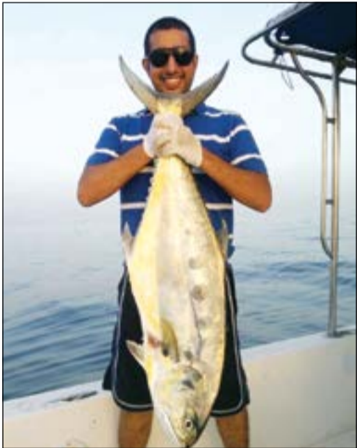
ضلع ولا أروع