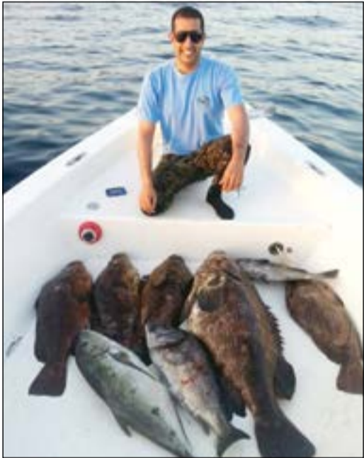
صيد طيب بإحدى رحلات الغوص