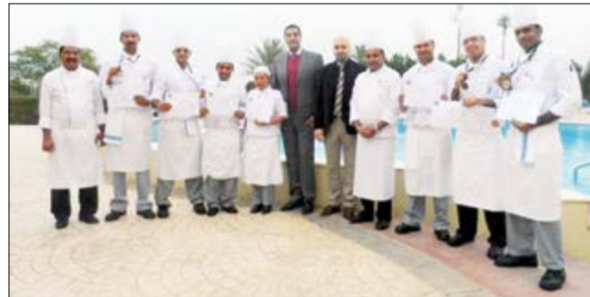
لقطة تذكارية لفريق طهاة فندق ومنتج كوبثورن سليل الجهراء

الطهاة الدوليين لتقييم أصناف الطعام المقدمة من قبل المتسابقين من