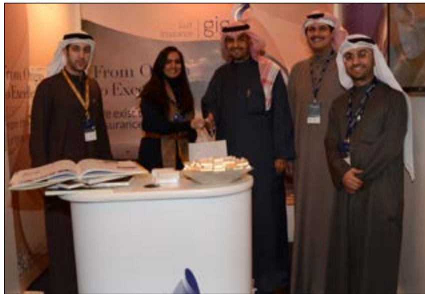
وزير المالية ومسؤولو «الخليج للتأمين» في جناح الشركة