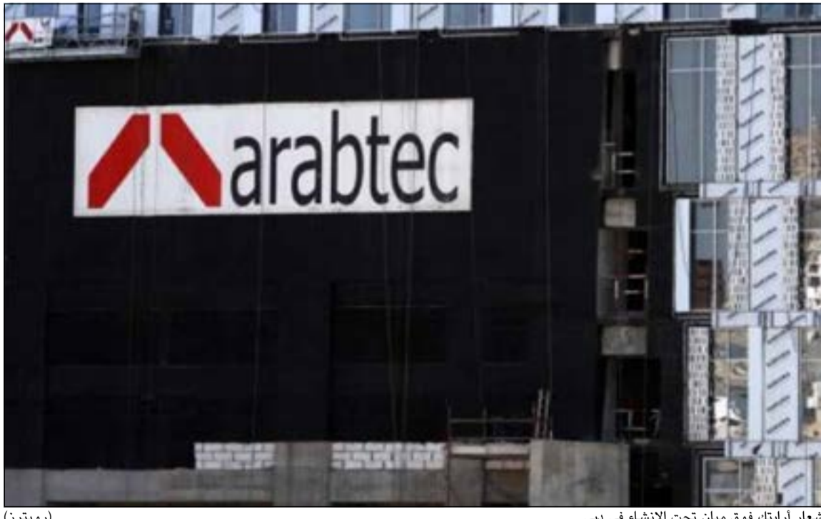
شعار أرابتك فوق ميان تحت الإنشاء في دبي