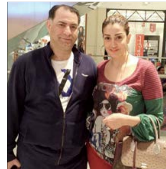
غادة مع زوجها في «دبي مول»

كشفت الإعلامية والفنانة اللبنانية رزان مغربي أنها رفضت الإعلان عن زواجها سابقاً من المصري ناجي جبران وأن حملها هو الذي أجبرها على ذلك، وقالت: رفضت الإعلان عن زواجي الذي احتفلت به في لندن ولبنان، لأنني لا أحب استقلال حياتي الخاصة من أجل البروز في الساحات الفنية والإعلامية، مضيفة: شعرت بأنه من حق طفلي الأول علي الإعلان عن هذا الحدث السعيد.