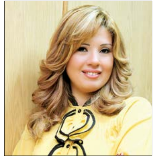
رانيا فريد شوقي

وقد أبدت سعادتها بالعودة إلى المسرح بعد غياب، وذلك منذ قدمت «رينا بخلي جمعة»، كما قالت، بحسب موقع «نواعم»، أنها تقراً حالياً العديد من السيناريوهات لتقرر أي عمل درامي جديد ستشارك من خلاله في الموسم الرمضاني هذا العام، خاصة بعد النجاح الذي حققه مسلسلها «نقطة ضعف»، الذي شاركت في بطولته إلى جانب جمال سليمان. يذكر ان رانيا فريد شوقي حصلت أخيراً على جائزة أفضل فنانة عن دورها في المسلسل من خلال قنوات ART، وقد اعتبرت رانيا ان هذا التكريم هو الا مسؤولية أكبر، ولذلك فهي تتأني كثيراً في اختيار أدوارها.