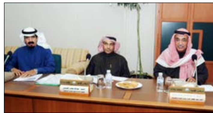
د.عبدالحسن المدعج وأركان وزارة التجارة خلال الاجتماع