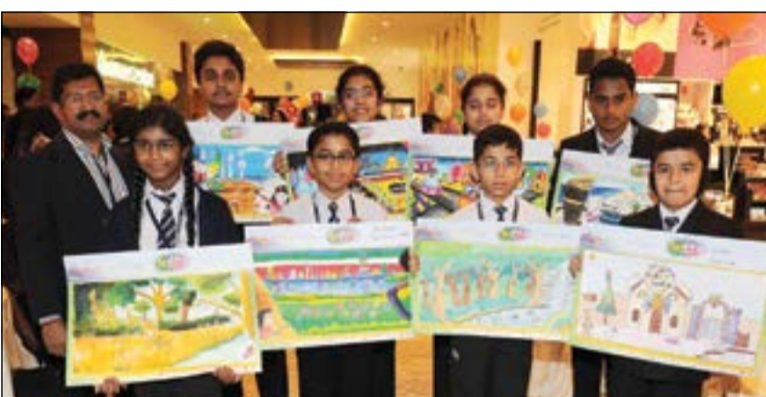
عدد من المشاركين مع رسوماتهم

وحصل الفائزون على جوائز وشهادات ودروع تذكارية، في حين حصلت المدارس على شهادة مشاركة في المسابقة، كما حصل جميع التلاميذ المشاركين على هدايا قيمة وشهادات مشاركة.