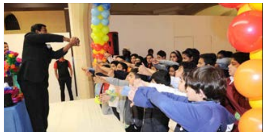
مسابقات للحضور والمشاركين