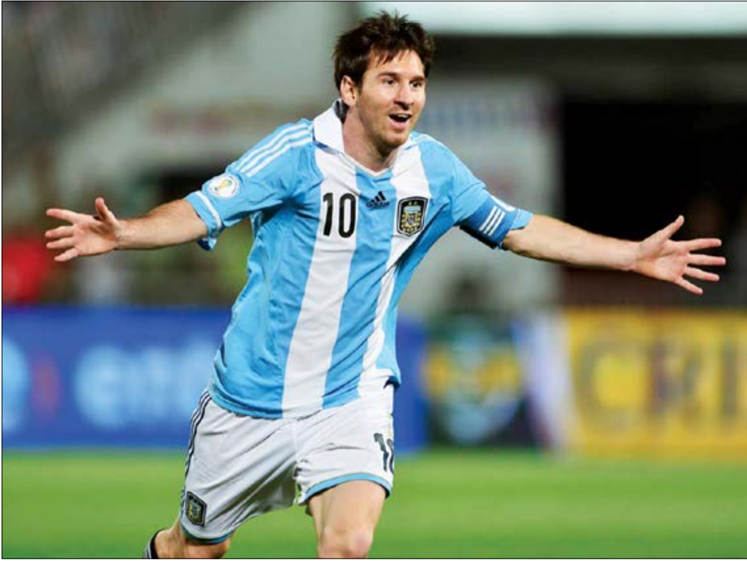
ميسي الأعلى في مونديال السامبا