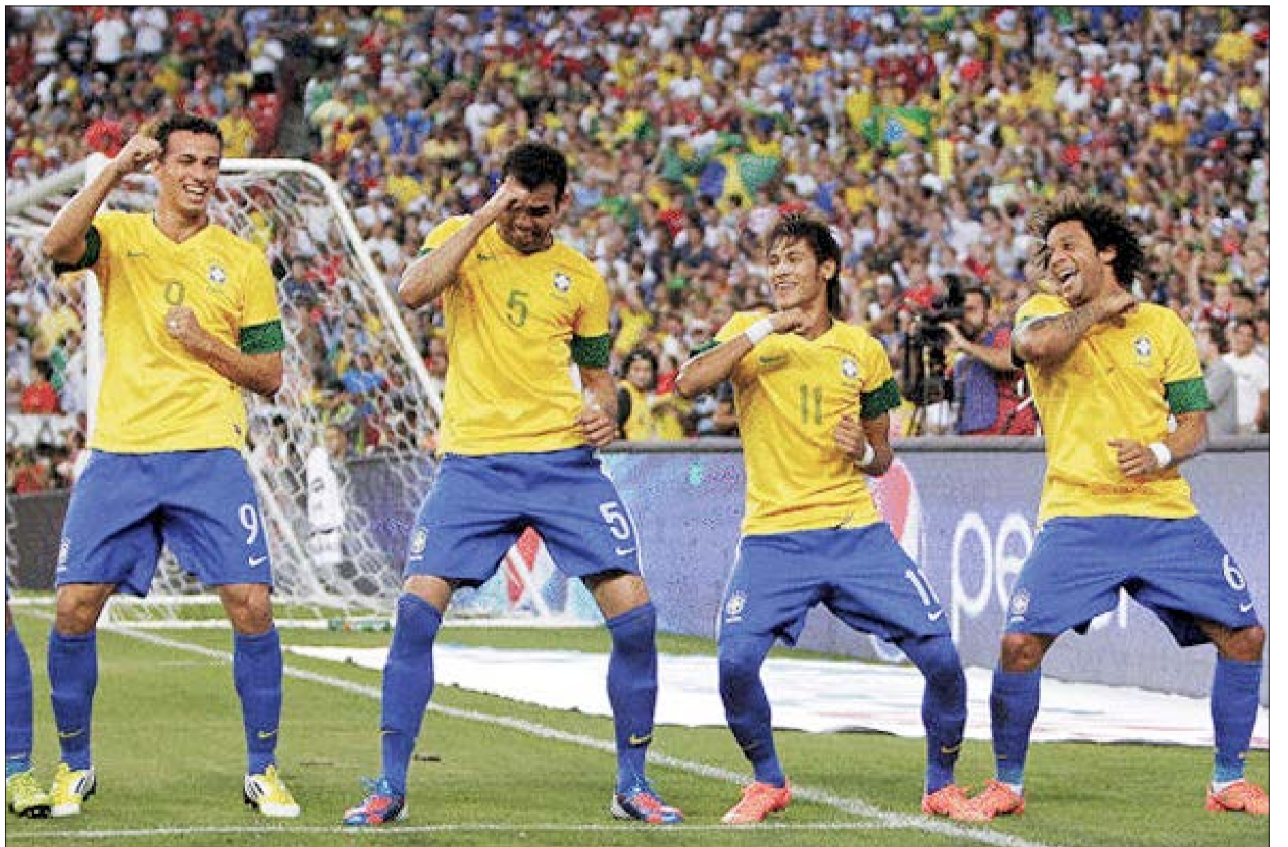
نجوم السامبا والأمل المنتظر في رفع كأس العالم أمام جمهورهم

الأرجنتينيين في المركز الثاني في عدد الانتقالات برصيد 695 صفقة بينما يأتي لاعبو أوروغواي في المركز السابع برصيد 350 صفقة رغم أن تعداد البلد يبلغ 3,3 ملايين فقط، ورغم العدد الكبير من الصفقات انتقل اللاعبين الأرجنتينيين فإنها انخفضت بمقدار 91 صفقة في العام الماضي.