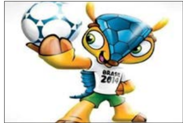
تعويذة مونديال البرازيل

كولومبيا واليونان وكوت ديفوار واليابان في المركز الثامن الأخير بإجمالي قيمة سوقية يبلغ 518 مليون