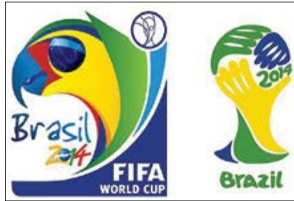
شعار المونديال و«الفيفا» 2014

يورو. واعتمدت الشركة في دراستها في تقدير القيمة السوقية للاعبين على 77 معيارا لخصتها في 18 بندا، منها أعمار اللاعبين وقدراتهم الفنية والتكتيكية والمركز في الملعب والخبرة الدولية والألقاب الفائزة بها. وتصدر النجم الأرجنتيني ليونيل ميسي اللائحة الفردية للاعبين الأعلى قيمة في السوق بمبلغ 139 مليونا و600 ألف يورو وتلاه النجم البرتغالي كريستيانو رونالدو بمبلغ 104 ملايين و200 ألف يورو والمهاجم البرازيلي نيمار بمبلغ 53 مليونا و700 ألف يورو. فيما تصدر المنتخب