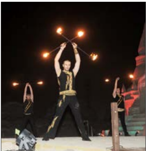
من استعراضات القرية الرملية