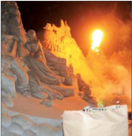
إضرام نار في القرية الرملية