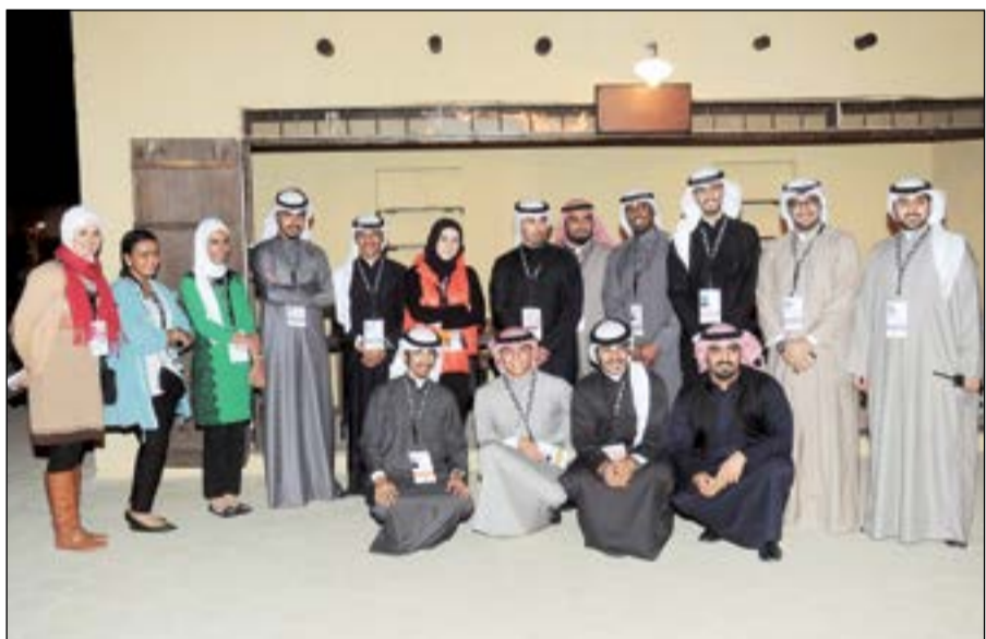
عدد من متطوعي اللجنة الإعلامية