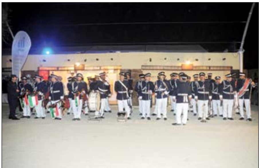
جانب من العروض المشاركة في الافتتاح