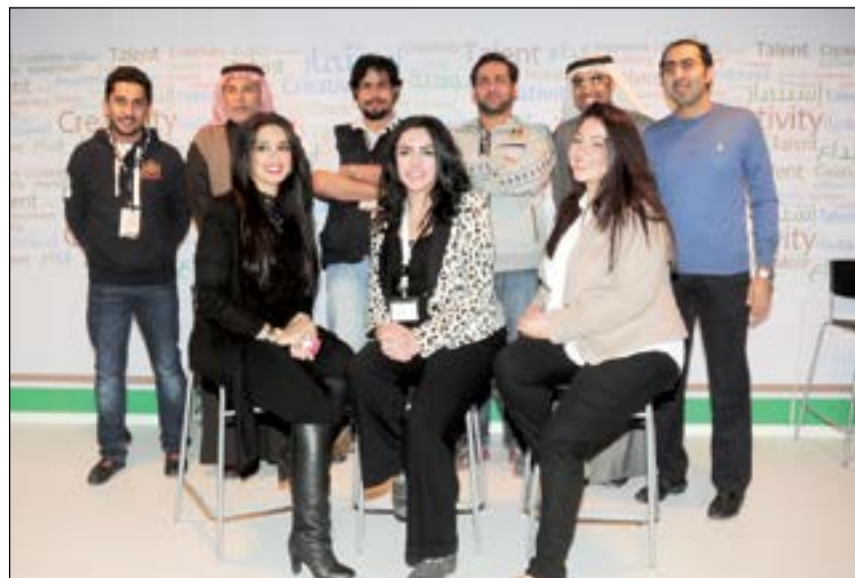
جناح مركز صباح الأحمد للموهبة والإبداع