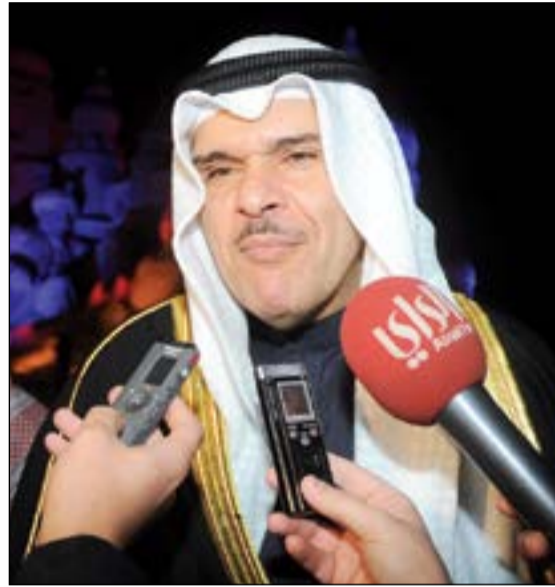
الشيخ سلمان الحمود يتحدث للصحافيين