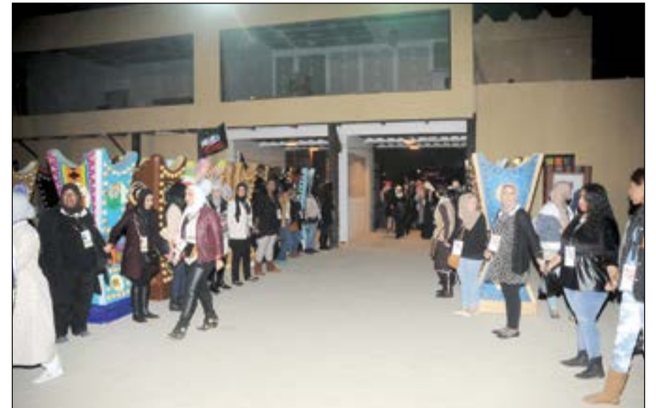
«مبخر» في استقبال «كويتي وأفتخر»