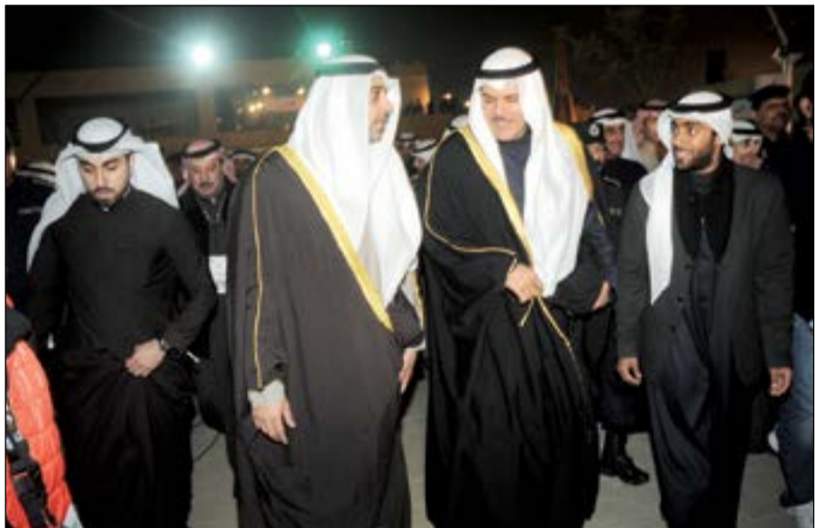
الشيخ سلمان الحمد والشيخ محمد عبدالله خلال جولة في القرية