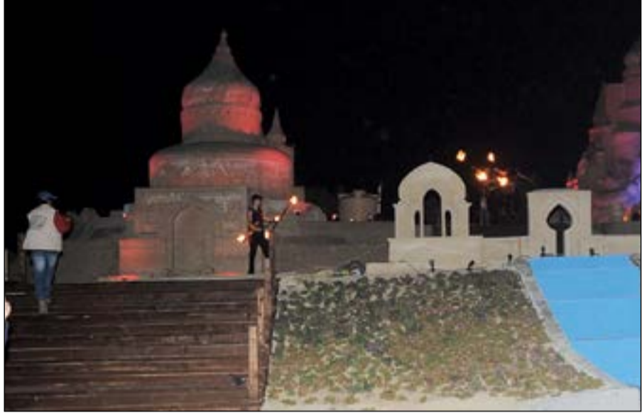
قرية رمال الدولية