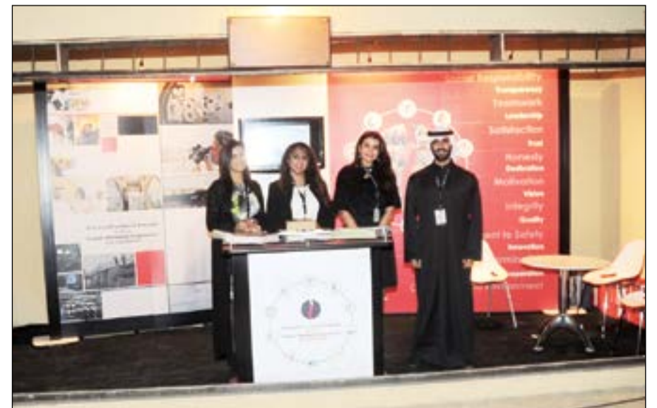
جناح مؤسسة البترول الكويتية