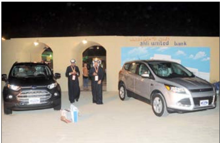
حضور لسيارات فورد في الملتقى

فولفارت: كويتي وأفتخر حكاية نجاح والدليل استمراريته