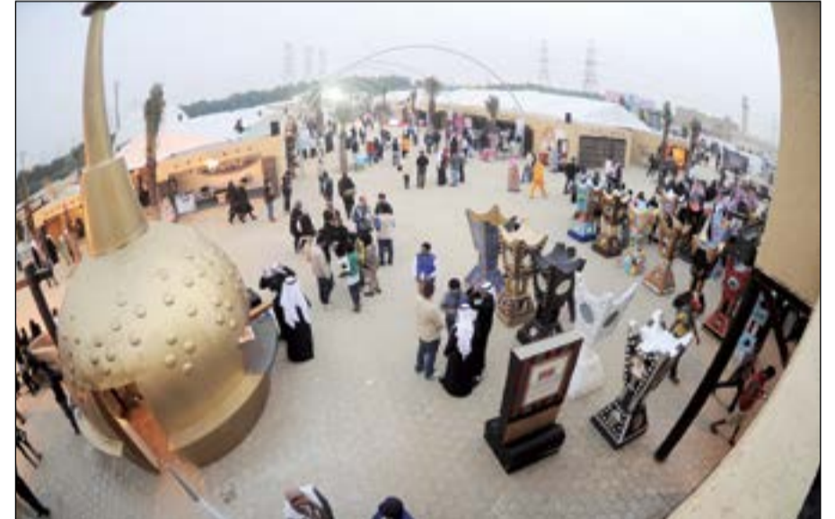
قرية «كويتي وأفتخر» التراثية