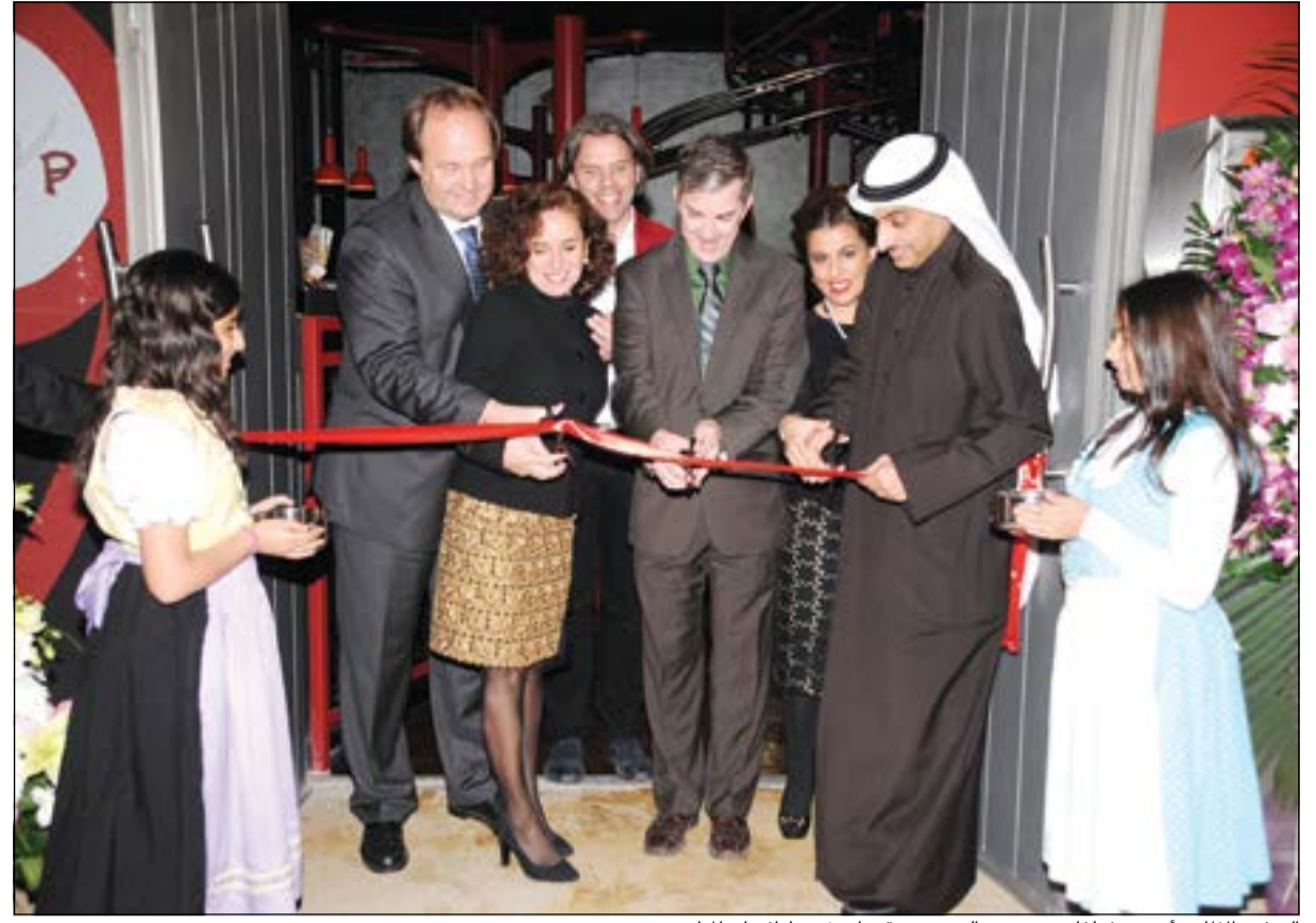
السفير الألماني أويجن فولفارت ومحمد العنجري يقصان شريط افتتاح المطعم