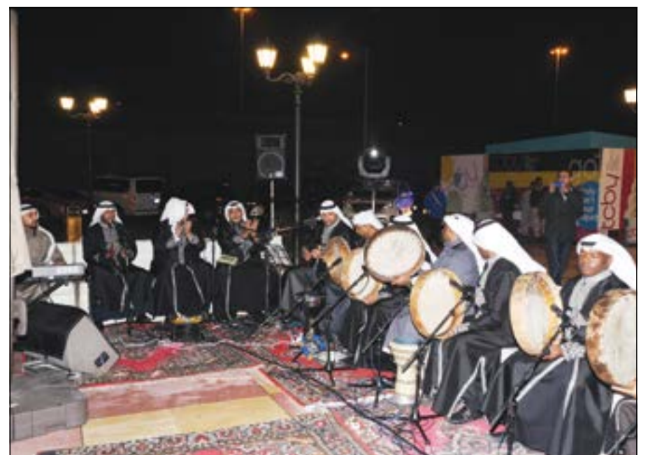
مشاركة من الفلكلور الكويتي خلال الافتتاح