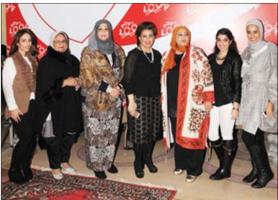
عدد من الزوار