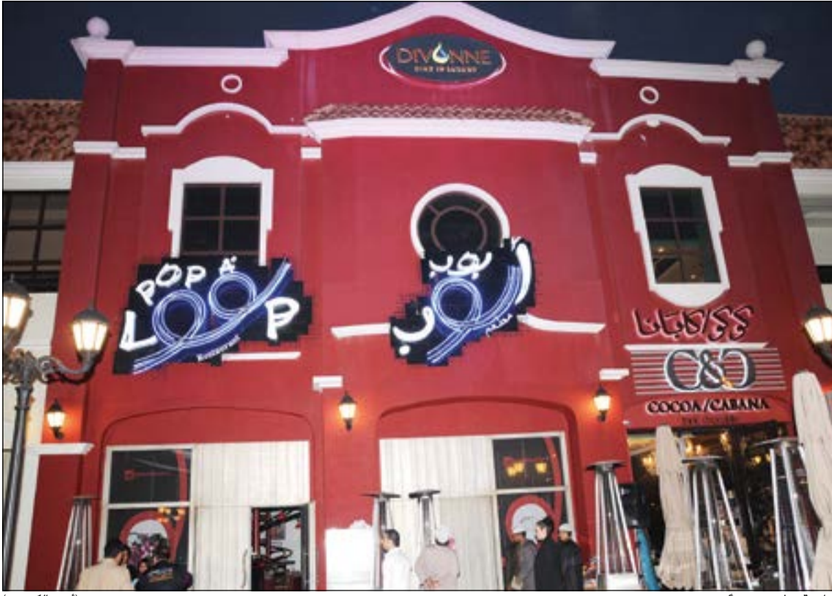
واجهة مطعم «بوب الوب» (أنور الكندري)