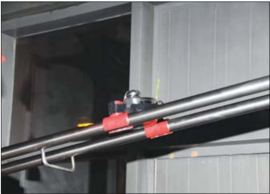
الطبق في طريقه إلى الطاولة

تجربة فريدة من نوعها يعيشها زوار مطعم «Pop a loop» في مجمع ديفون، حيث يستطيعون التمتع بالأطباق المفضلة لديهم في أجواء لا تخلو من المرح والخيال والطرافة في بعض الأحيان، فانتظار وصول الطبق عبر الـ «rollercoaster» فيه الكثير من المتعة والحماس ويجعل من وقت الطعام وقتا مسليا. واعتبر السفير الألماني لدى الكويت أويجن فولفارت أن افتتاح هذا المطعم يعكس اهتمام الكويت بالأفكار الجديدة والخلاقة بما فيها التطور التكنولوجي، ووصف المطعم بالمكان المرح والعائلي، مشيدا بالتنوع الموجود في قائمة الطعام، وقال إن هذا التنوع بقائمة الطعام موجود