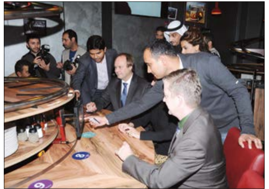
متابعة لعملية طلب الطعام عبر اللوحة الذكية