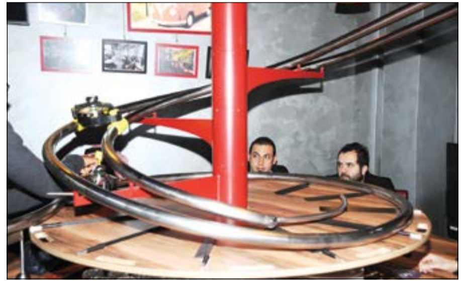
رحلة الأطباق عبر الـ «rollercoaster»