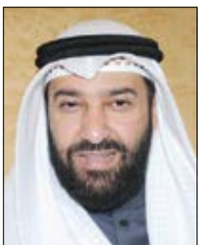
وزير النفط د.علي العمير

وبين العمير أن مجلس إدارة مؤسسة البترول عرض جميع الدوافع التي من أجلها أخذ قرار تخفيض الحوافز والمكافآت، مبيناً أن مجلس الإدارة أخذ بعين الاعتبار الأسس القانونية والإجراءات التنفيذية وقواعد صرف مكافأة «المشاركة» في النجاح، بالإضافة إلى تقارير ديوان المحاسبة عن السنوات المالية السابقة والتي أظهرت استمرار إقرار نظم تتضمن مزايا مالية فيها توسع. وأشار إلى أن النقابات النفطية عليها ضغوط كبيرة من العاملين لسحب قرار تخفيض الحوافز والمكافآت، وفي الوقت ذاته يوجد ضغط كبير من الجهات الرقابية في الدولة على مؤسسة البترول لتقنين أنظمة الحوافز والمكافآت المعمول بها في النفط، لذا فإن المشكلة الحالية لا بد أن يكون فيها تفهم من الطرفين لكي نصل إلى حل معقول، وأضاف العمير: «إن ما حصل هو تباين لوجهات النظر بين النقابات ومجلس إدارة المؤسسة الذي اتخذ قراراً قبل أن أتولى مسؤولية الوزارة». وأضاف: «أن أسوأ الوزارة مفتوحة للاستماع إلى وجهات نظر الموظفين، من دون أن تضع فرصة سانحة للجميع تحول دون تنفيذ الإضراب، كما أن الشباب العاملين في القطاع النفطي لهم كل تقدير واحترام، ولا أعتقد أنهم يهدون بلدهم ويضيعون مصالحه».