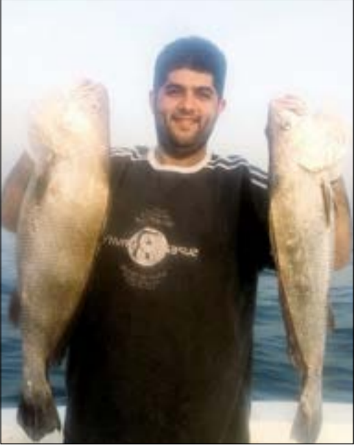
فروخ شمامية روعة

«بحري» صفحة تستقبلكم كل أربعاء بكل ما يعنى بالبحر وهواية الحدائق أسبوعيا تسلط الضوء على هذه الهواية، ونستقبل مشاركاتكم وصوركم وآراءكم للتواصل معنا عبر هذه الصفحة أرسلوا تعليقاتكم على الايميل: bahri@alanba.com.kw