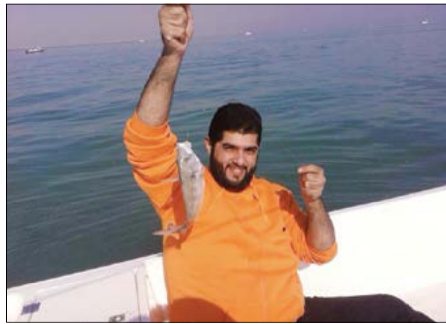
هذا أول الرزق

أماكن أخرى جربت الصيد بها ووجدتها غنية بالأسماك. ● أجمل مكان جربت به الصيد بصراحة هو بعمان والصيد هناك ليس له وصف نهائيا وخصوصا بمنطقة مصيرة فالصيد بها ليس له مثيل نهائيا ففيها جميع انواع الأسماك