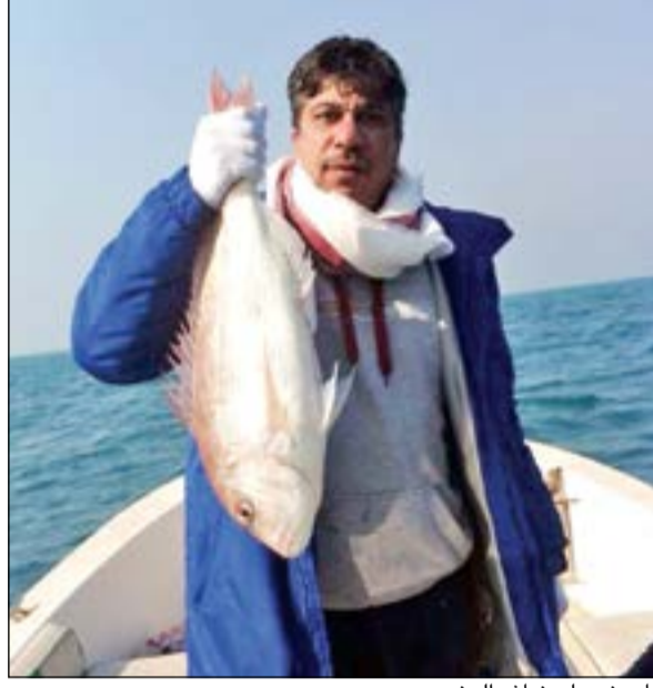
يا عيني على نهاش الجنوب