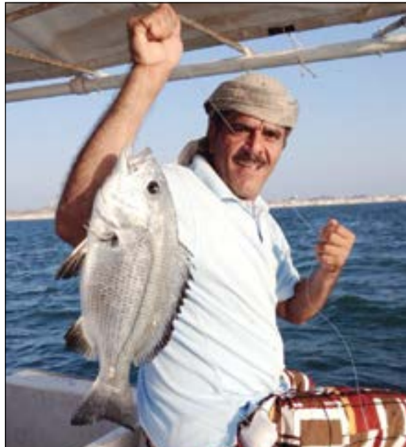
احجام اسماك عمان خيالية