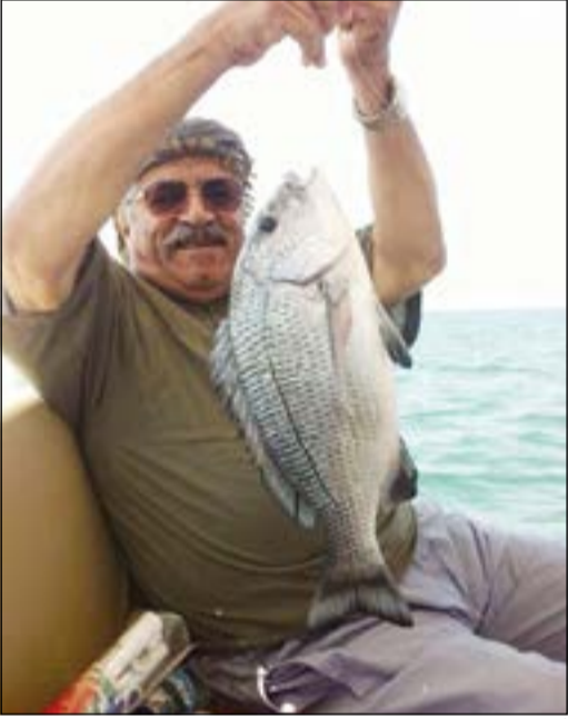
أحلى صيد عمان