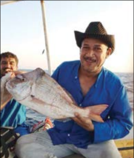
ثور عندق مصيرة