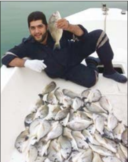
صيد الشعوم بالحيشان