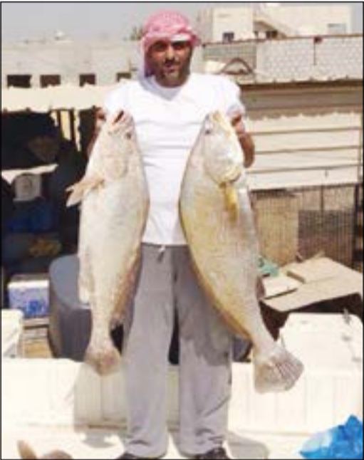
تسمع بالشمامي .. هذا هو