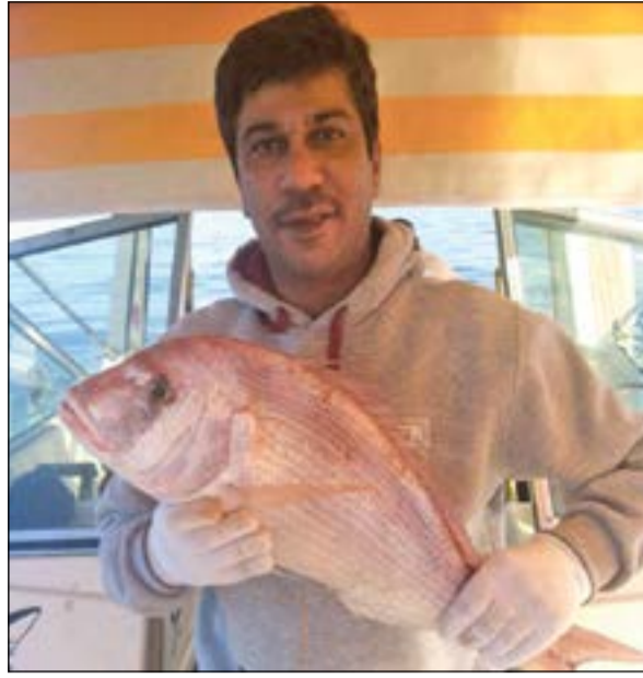
الجاركي مع النهاش