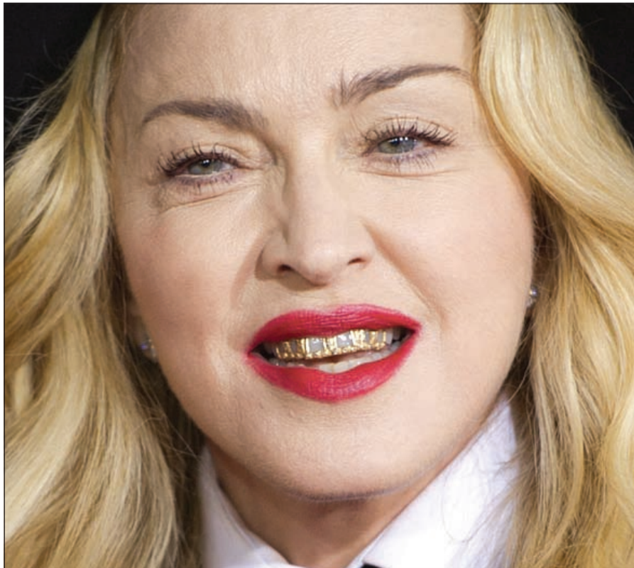
مادونا واسناتها الذهبية

لوس أنجيليس - أ.ف.ب: حصد ثنائي الموسيقى الإلكترونية الفرنسي «دافت بانك» اهم المكافآت في الحفل السادس والخمسين لجوائز غرامي الموسيقية بنيله جائزة أفضل تسجيل وأفضل البوم عن عملهما الذي حقق نجاحاً عالمياً «راندوم أكسيس ميموريز». وفاز الثنائي الذي ارتدى بزة بيضاء واعتمر خوذة وبقي صامتا على عاتقه، بجوائز أفضل اغنية ثنائية وأفضل تسجيل عن اغنية «غيت لاي» مع فاريل وليامز وأفضل البوم وأفضل اليوم دانس/الالكترو. وكافأت الامسية أيضاً مهندسي الصوت الذين اعدوا الالبوم. وتكلم فاريل ولامز باسم «الروبوتين» وقال «انا على ثقة ان فرنسا فخورة بهذين الشابين الآن». وقد حول الثنائي المؤلف من توما باتاغاتييه وغي-مانويل دو اومب-كريستو مسرح مركز «ستايبيلز سنتر» الى مرقص فعلي مثيرين حماسة الحضور الذي راح يرقص،