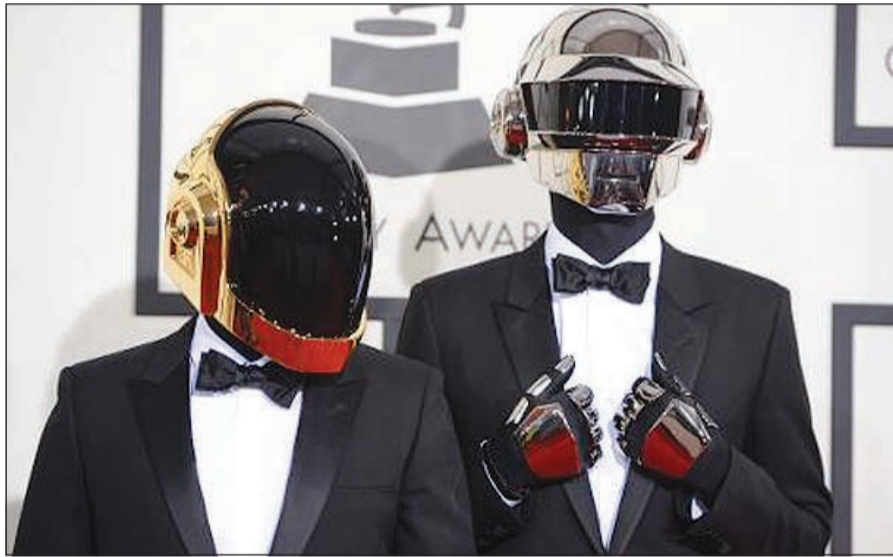
الثنائي دافت بانك