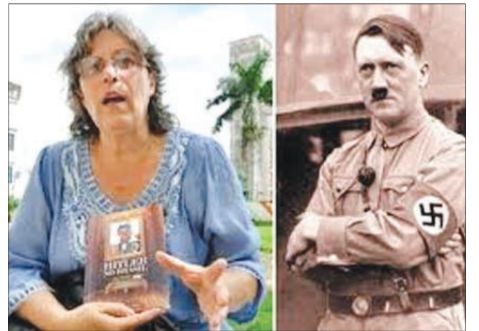
هتلر ومؤلفة الكتاب

لندن - وكالات: شغلت كاتبة برازيلية العالم ودوخت فضولييه طوال الأسبوع الماضي بصورة نشرتها في كتاب أصدرته لتؤكد فيها أن أدولف هتلر لم يمض عام هزيمة ألمانيا بالحرب العالمية الثانية، بل فر منها إلى البرازيل، وفيها عاش متنكراً باسم مختلف، ثم توفي في 1984 بأرذل العمر الذي طال به 95 سنة، مع أن المعروف عن «الفوهرر» الذي ولد في 1889 أنه قضى منتحراً منذ 69 عاماً في مخبئه ببرلين.