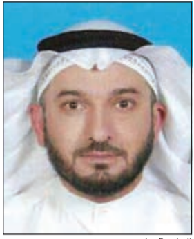
الداعية ياسر يوسف