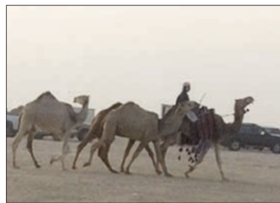
نباق مشاركة في طريقها إلى مقرها

التي لم توقع أن تكون بهذا الشكل الرائع فيجب أن ننفي على القائمين على هذا العمل الجبار وتتمنى أن نشاهده في ختامه كبدايته لاننا سننتظره في كل عام. وقال مشعل المطيري أننا حضرنا هذا المهرجان لمشاركة