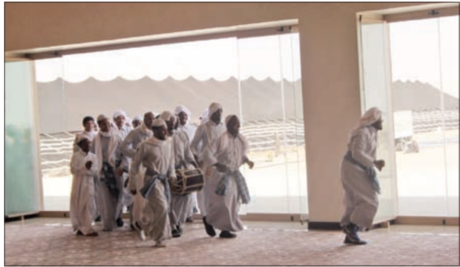
من المشاركين في العروض التراثية