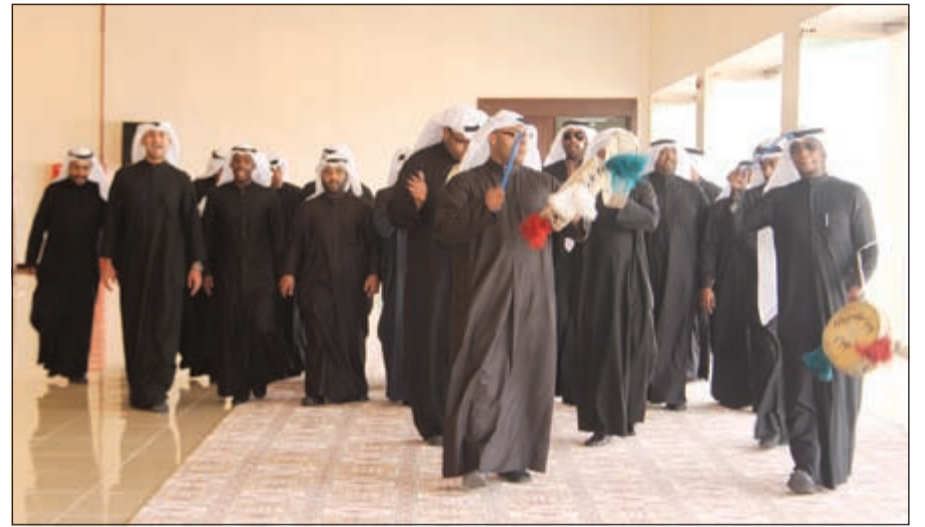
إحدى الفرق الشعبية