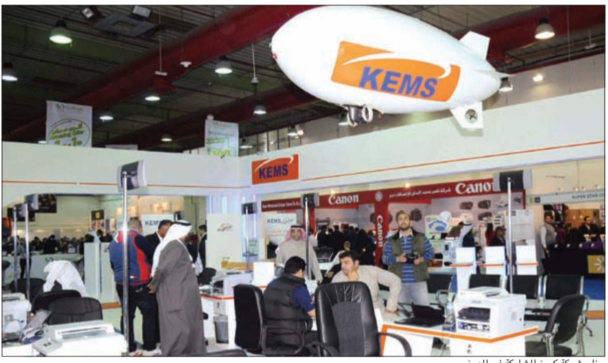
جناح شركة كيمز المشاركة في المعرض