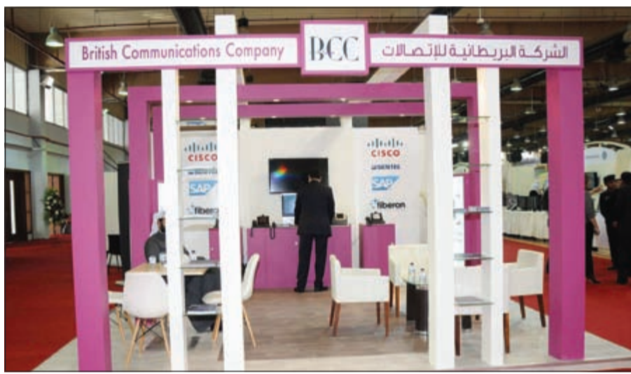
جناح مميز لـ «البريطانية للاتصالات» في معرضي انفوكونت وانفويز

المعلومات (IT) والبرمجيات والتقنيات الأمنية، مشيراً إلى أن الشركة تسعى إلى توفير حلول مبتكرة للعملاء من خلال بيئة ديناميكية للعمل والحفاظ على أفضل مستوى من الدعم. وبين أن الشركة البريطانية للاتصالات لديها حق الوصول إلى أحدث التطورات في التكنولوجيا من خلال شراكتها مع الشركات ذات الشهرة العالمية Cisco، Sentel، SAP، وFiberon، وفيما يلي نبذة عن تلك الشركات: شركة SAP «أس ايه