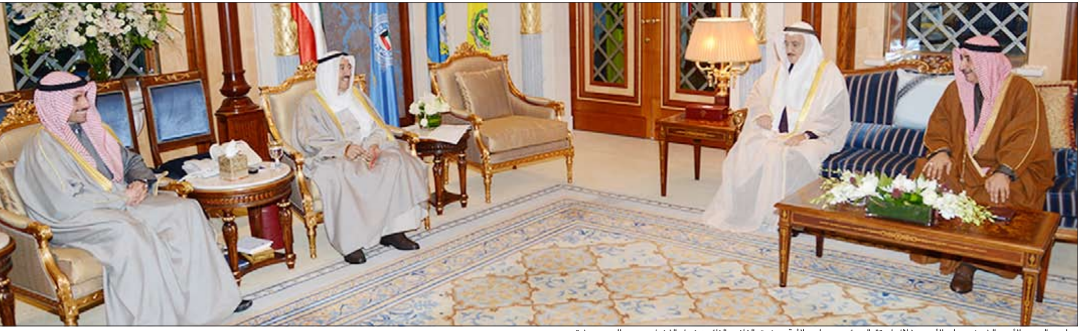
صاحب السمو الأمير الشيخ صباح الأحمد خلال استقباله رئيس مجلس الأمة مرزوق الغانم والنائب نبيل الفضل ود.عبدالحמיד دشتي