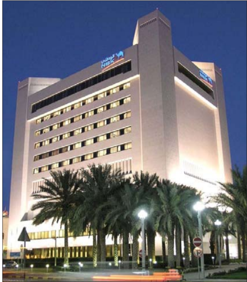
40 مليون دينار صافي دخل البنك الوطني في الربع الأخير من 2013