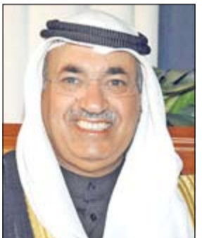
د. عبدالمحسن المدعج