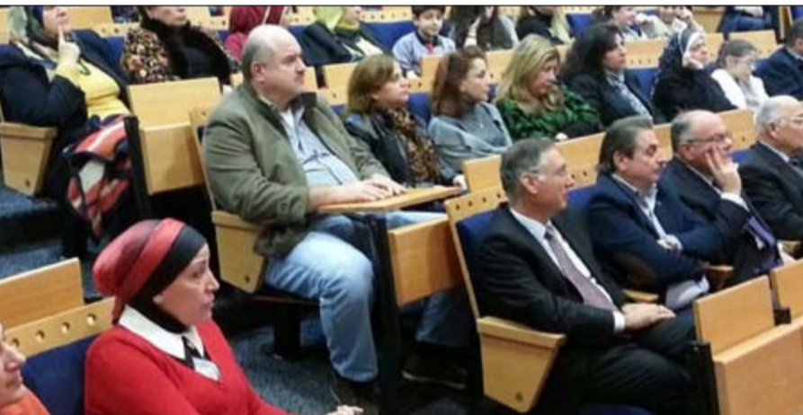
المحذون خلال الندوة