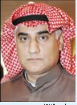
م. مجسم التقاوي