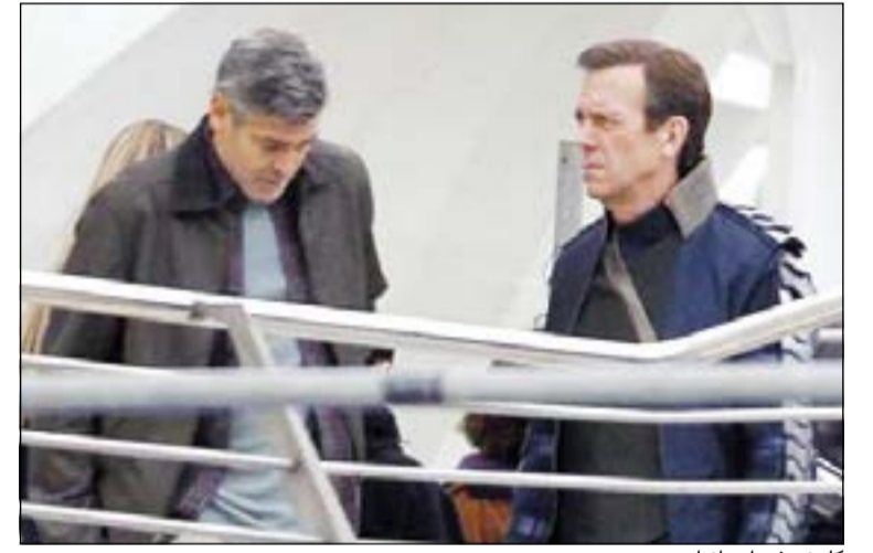
كلوني في إسبانيا

وكالات: التقطت وسائل الإعلام الأميركية صورا للنجم جورج كلوني، من موقع تصوير فيلمه الجديد Tomorrowland في فالنسيا - إسبانيا، وكان كلوني تصوير الفيلم برفقة