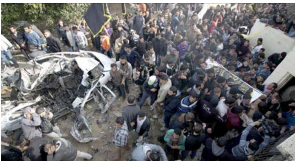
فلسطينيون يشيعون مسؤولا في الجهاد الإسلامي قضي بغارة اسرائيلية على سيارته في بيت حانون امس (رويترز)

واشنطن - كونسا: رحبت الولايات المتحدة الأمريكية باختيار أول رئيسة لجمهورية أفريقيا الوسطى المتوقع أن تقود بلادها التي يمر فيها الصراع الطائفي إلى الانتخابات خلال سنة تقريبا. وقال وزير الخارجية الأمريكي جون كيري في بيان أن «الولايات المتحدة ترحب باختيار أول رئيسة لجمهورية أفريقيا الوسطى منذ استقلالها وبخلفيتها في العمل في مجال حقوق الإنسان والوساطة لديها فرصة فريدة للمضي قدما في عملية الانتقال السياسي وجلب جميع الأطراف معا لوضع حد للعنف وقادة بلادها للانتخابات في موعد لا يتجاوز شهر فبراير عام 2015.