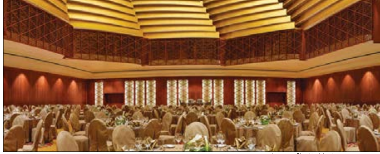
فندق ومنتجج جميرا شاطئ المسيلة.. وتجهيزات متميزة