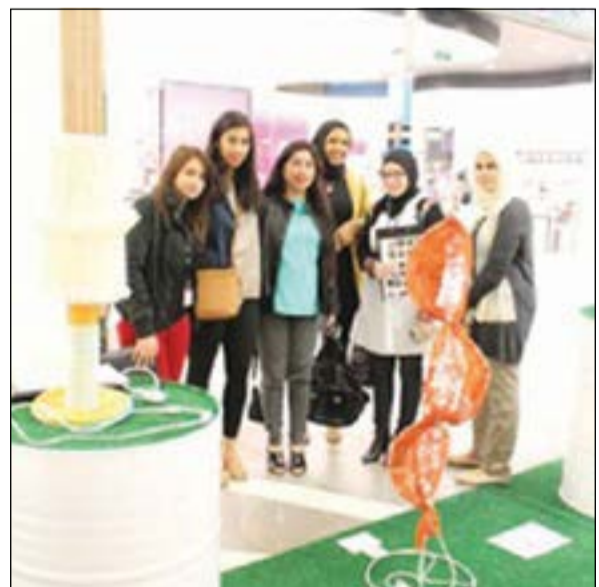
جانب من المشاركات