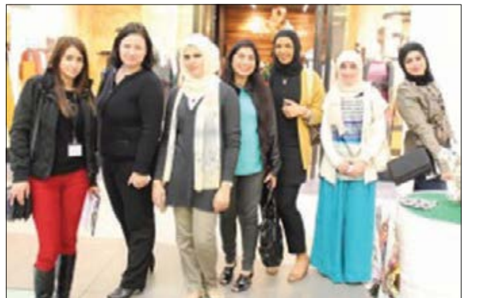
لقطة لطالبات المشاركات بالمعرض

الديكور والتصميم الداخلي في كلية بوكسهل، بأن من أهم أهداف القسم في كلية بوكسهل الأخذ في الاعتبار نمط الحياة والأفضليات البيئية، لخلق أفضل التصاميم الداخلية باستخدام أقل قدر من الموارد المضرّة في البيئة، كما أوضحت أنه يمكن تخفيض نسبة الاستهلاك من خلال إعادة تدوير مواد يمكن استخدامها من جديد، حيث يساعدنا على المضي قدماً نحو اتجاه إيجابي مع البيئة. وتحرص كلية بوكسهل الكويت للبيئات دائماً على المشاركة في مثل هذه الأنشطة للحد من تطوير المهارات والقدرات في مجالات ميدانية. بحتة.