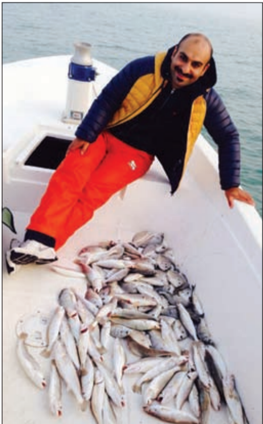
صيد الشمال، نوبيي