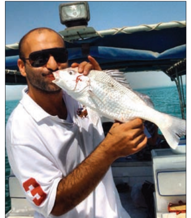
هذا التقرور الطيب