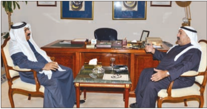
الشيخ ناصر صباح الاحمد خلال لقائه سفيرنا لدى أذربيجان

استقبل وزير شؤون الديوان الأميري لدى جمهورية أذربيجان الصديقة سعود