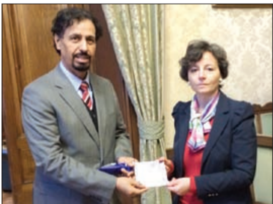
الشيخ علي الخالد مع وزيرة التعليم الإيطالية ماريا كيارا كاروتسا

روما-كويتا: بحث سفيرنا لدى إيطاليا الشيخ علي الخالد مع وزيرة التعليم الإيطالية ماريا كيارا كاروتسا امس افتتاح مركز تعليمي ثقافي إيطالي في الكويت في إطار تطوير التعاون التعليمي لفتح مزيد من المجالات أمام الطلبة الكويتيين للالتحاق بأرقى الجامعات والأكاديميات الإيطالية. وبحث السفير الخالد مع الوزيرة كاروتسا بمقر وزارة التعليم والجامعات والبحث العلمي بحضور الوزير المفوض جان لويجي بينديتي سبل تعزيز التعاون العلمي والتعليمي الثنائي لاسيما في المجال الأكاديمي والتقني الموجه نحو جذب الطلبة للدراسة في كل تخصصات الامتياز الإيطالي. وقالت كاروتسا في تصريح لـ «كونا» ان اقتراح السفير الخالد فتح معهد ثقافي إيطالي في الكويت للتأهيل والتعليم لخدمة الطلبة والدراسين والباحثين والمتخصصين من دول مجلس التعاون يهدف الى اشاعة تعليم اللغة والثقافة الإيطالية والتعهد للتحاق بالدراسة في إيطاليا. وأكدت ترحيبها بهذا المقترح في إطار الصداقة الخاصة التي تربط البلدين واهتمامها بتطوير وتوسيع