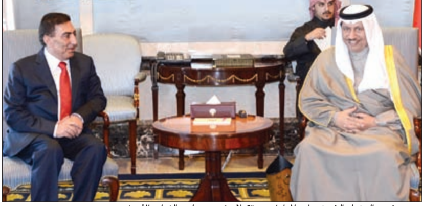
سمو رئيس الوزراء الشيخ جابر المبارك مستقبلاً رئيس مجلس النواب الأردني

له وذلك بمناسبة زيارته للبلاد للمشاركة في أعمال المؤتمر الـ 20 للاتحاد البرلماني العربي. حضر المقابلة رئيس بعثة الشرف المرافقة م.عاطف الطراونة والوفد المرافق