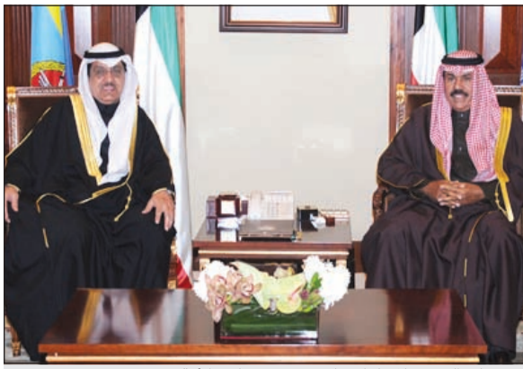
سمو ولي العهد خلال لقائه نائب رئيس مجلس الأمة