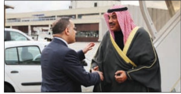
الشيخ صباح الخالد لدى وصوله إلى جنيف

التقى وكيل وزارة الخارجية خالد الجارالله امس النائب محمد الحويلة يرافقه عدد من أهالي المواطنين الكويتيين المحتجزين في العراق اثر قيامهم برحلة صيد هناك. وقد طمان الجارالله أهالي المحتجزين على أحوال المواطنين وأطلعهم على الجهود والاتصالات التي تقوم بها وزارة الخارجية مع المسؤولين العراقيين لضمان إطلاق سراحهم بالسرعة الممكنة.