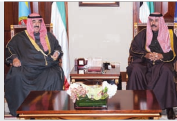
سمو ولي العهد الشيخ نواف الاحمد مستقبلاً سمو الشيخ ناصر المحمد