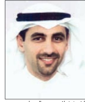
الشيخ نواف سعود الصباح

المشارك. وأوضحت كوفيك وهي إحدى الشركات التابعة لمؤسسة البترول الكويتية في بيان صحافي لـ «كونا» ان حصة شل للتطوير (أستراليا) المحدودة في مشروع «ويتستون - إياجو» المشترك تبلغ نسبتها 8% مشيرة الى ان الاتفاقية تشمل حصة شل في مشروع ويتستون للغاز الطبيعي