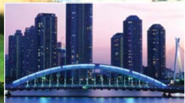
جسر ايتاي في طوكيو