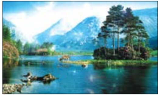
جانب من جمال الطبيعة الساحرة في اليابان