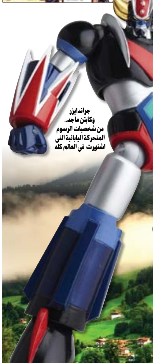
جراند ايزز وكابتن ماجد... من شخصيات الرسوم المتحركة اليابانية التي اشتهرت في العالم كله

«مانغا».. وقد ارتبط في أذهان الملايين من شعوب العالم شخصيات متميزة وأبطال من أعمال الرسوم المتحركة اليابانية والتي فاز بعضها بجوائز الأوسكار. كما أن هناك نقطة مهمة أود التطرق إليها، وهي أن اليابان تغلب عليها الديانة البوذية، وهي لا تدخل في صميم الحياة اليومية بعكس الإسلام، ومن هنا تجد اهتماما واسعا في اليابان تجاه فهم الإسلام. يتجلى ذلك في برامج التبادل الثقافي المهمة مع الكويت في مجال البعثات الدراسية للطلبة من كلا البلدين، وكذلك في مجال تدريس اللغة اليابانية في مركز اللغات بجامعة الكويت، وتدريس اللغة العربية في مراكز يابانية أيضا.