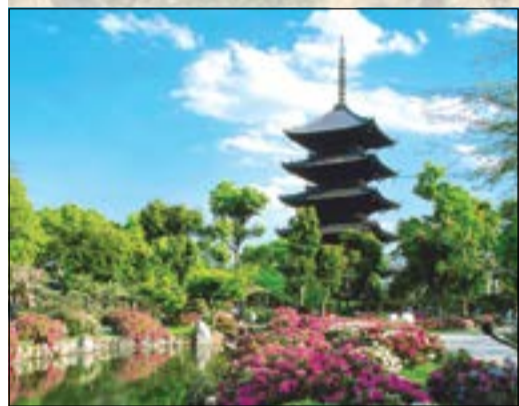
العمران الياباني التقليدي المميز