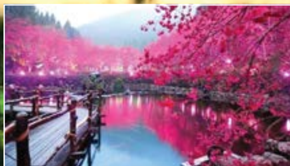
تفتح زهور الكرز ساكورا في الربيع والذي يمثل حدثا مهما