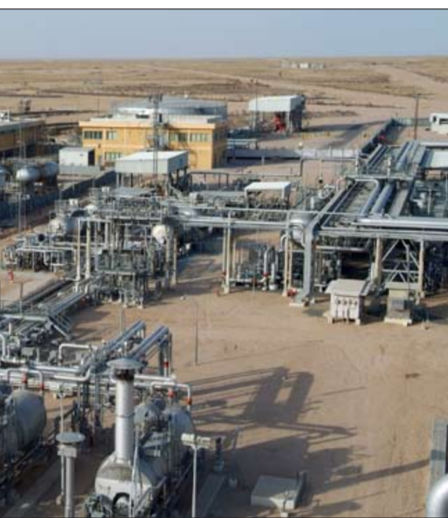
مشاريع ضخمة لتطوير إنتاج حقول النفط في شمال الكويت